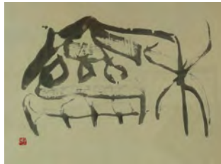
廣津雲仙《和》 諫早市美術・歴史館所蔵

楷書から隷書、篆書の多岐にわたる分野で格調高い作品を数多く残し日本書道界の重鎮として活躍、「現代書の巨匠」と称される本市出身の書家の生誕110年を記念しその業績を振り返ります。