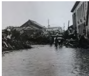
親和銀行(当時)前の本町通りを埋めた流木(本町)

今から63年前の昭和32年(1957)7月25日に発生し、死者・行方不明者630名を出した諫早大水害。被災地の写真と映像で被害の実態を振り返ります。近年多発する大規模な災害への警鐘とするための企画展です。