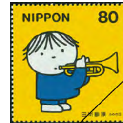
ふみの日(郵便友の会結成50周年) 《トランペットとぼく》1999年発行

「切手は小さな芸術品」と言われます。小さな画面に表現された精緻な世界はいつの時代も人々の関心を集め、根強い人気を誇っています。本展ではアート作品としての切手に焦点を当て、1973年~2000年に国内で発行された切手を紹介します。