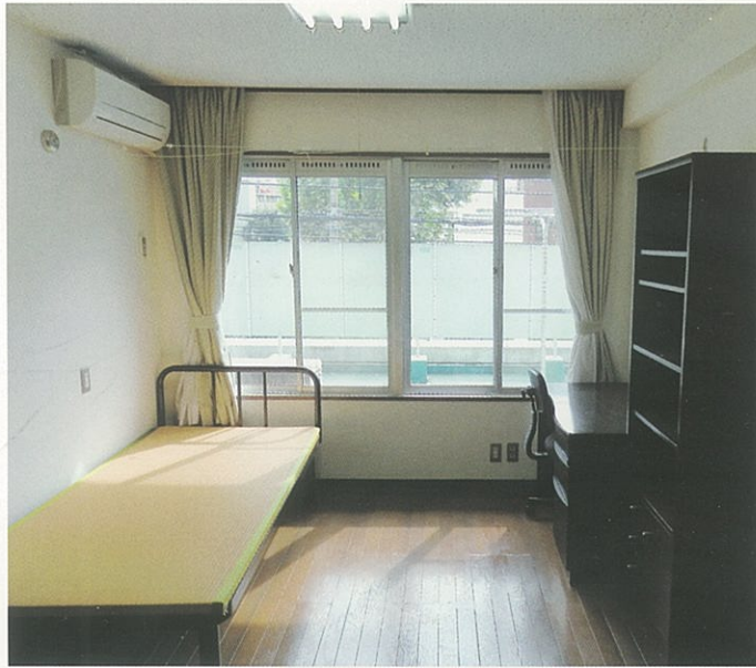
学 生 室 約12㎡の洋室