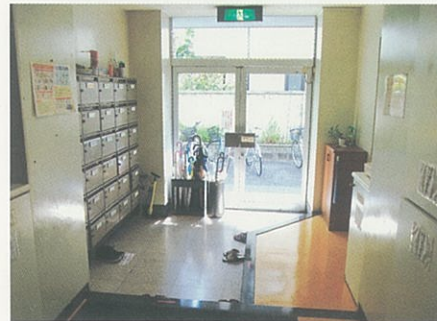
学 生 玄 関