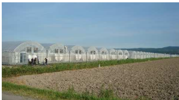
強い農業づくり交付金事業により整備した ミニトマトハウス