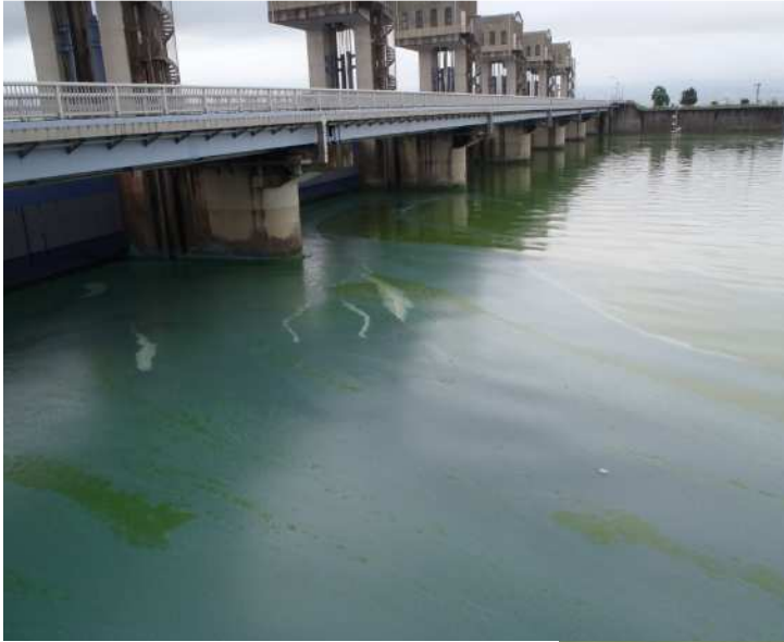
北部排水門でのアオコの発生状況