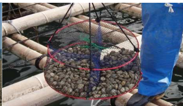
新たな方法で養殖した小長井町漁協の『垂下 式ゆりかごあさり』