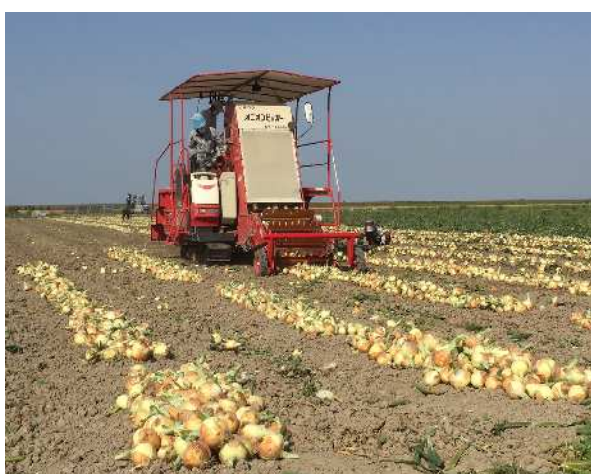
大型機械の導入による玉葱の収穫作業