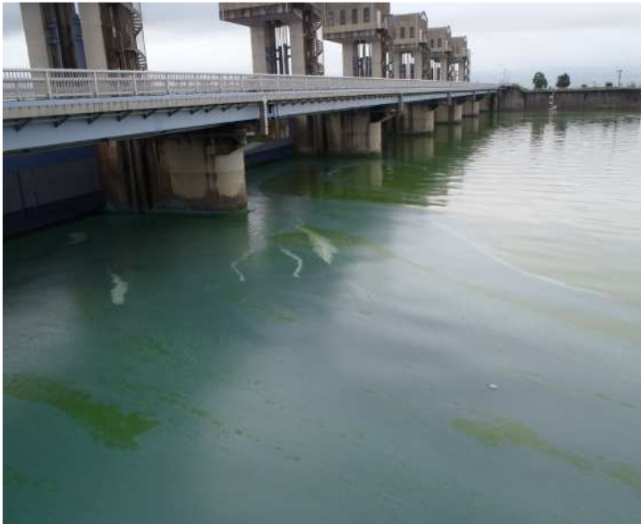
北部排水門でのアオコの発生状況