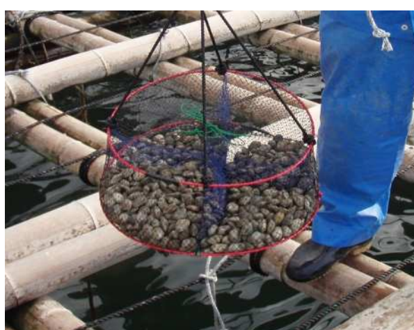
新たな方法で養殖した小長井町漁協の『垂下式 ゆりかごあさり』