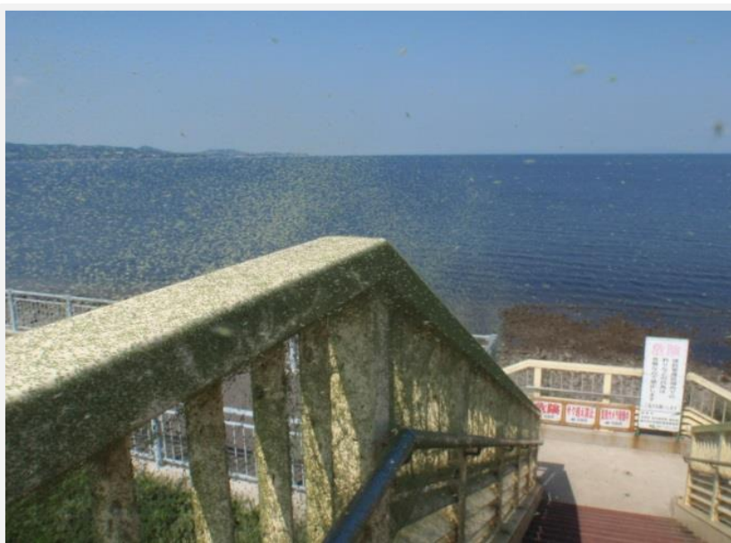
潮受堤防でのユスリカの発生状況