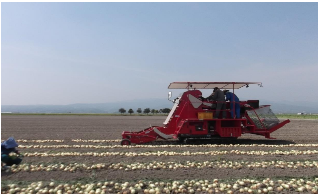
中央干拓地での環境保全型農業で栽培したタマネギ収穫状況