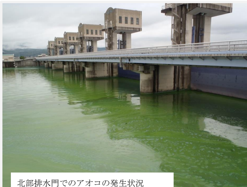
北部排水門でのアオコの発生状況