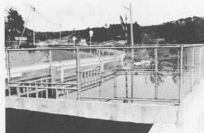
第4分団区域防火水槽