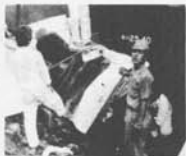
3月17日から4月5日まで

このため国鉄では、三月十七日から四月五日までを鉄道妨害防止運動と定め、このような事故防止活動を推進することになります。町民の皆さんもこのような事故のないよう次のことを守つてご協力下さるようお願いいたします。