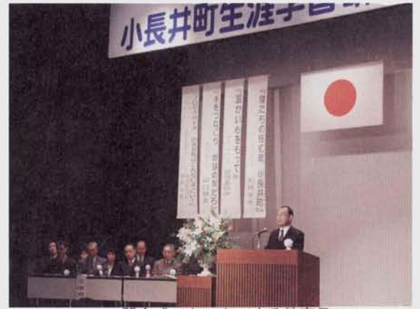
▲開会式であいさつする教育長

2月2日(日)、第15回小長井町生涯学習研究大会がハートフルホールで開催され、約500人の町民が集いました。