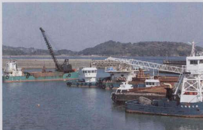
▲築切港に寄港している大船

※この他に13種類の試験を行っています。 くわしくは、九州安全衛生技術センター(TEL0942-43-3381)へ。 〒839-0809 福岡県久留米市東合川5丁目9番3号