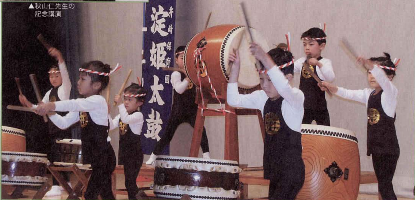
▲井崎保育園の園児たち