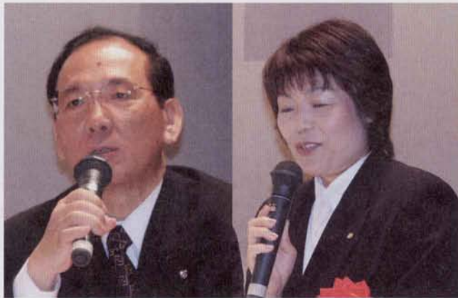
▲助言をする古賀町長(左)と松本指導主事(右)