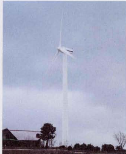
◀スイッチが押され、ゆっくりと動き始めた3号機

なお、平成7年度から取り組まれた山茶花高原での風力発電施設整備事業は、今回の3号機の完成をもって計画のすべてを完了しました。