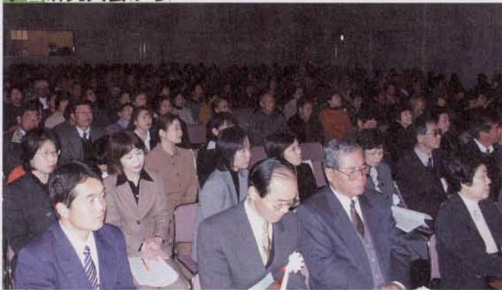
▲会場に集まった多くの参加者