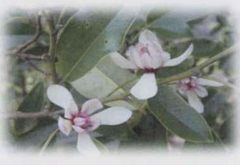
▶ 白い花を咲かせたオガタマノキ (2月中旬撮影)