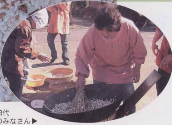
花炒りをする田代1-2の婦人のみなさん▶