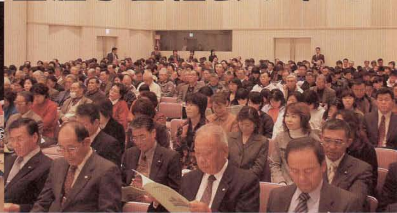
▲会場いっぱいの参加者