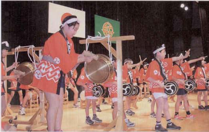
▲長立会による長里浮立