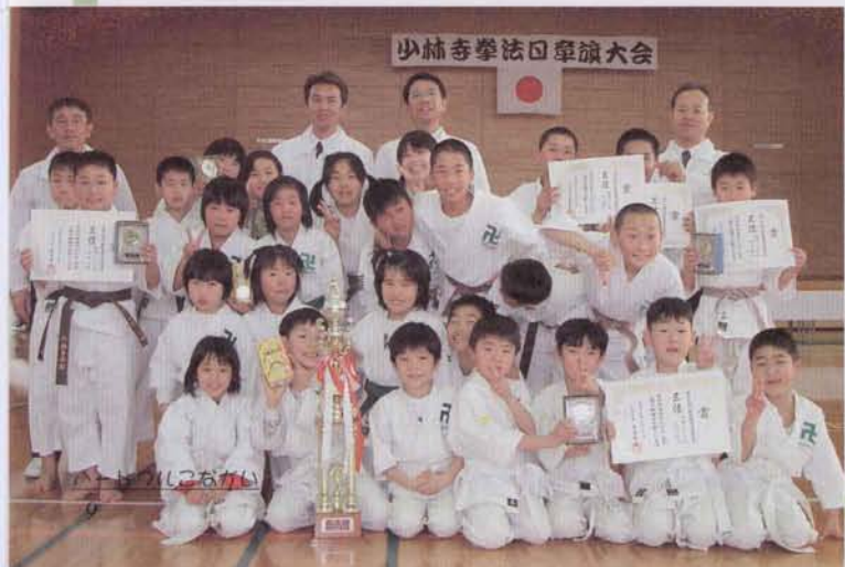
◀小長井支部の少年拳士たち

お年寄りの知恵袋から学ぼうというテーマのもと、指導してもらってお年寄りの皆さんに作り方を習いながら、いろんなおしゃべりをして交流を深め、昔の人々の生活に想いを馳せました。