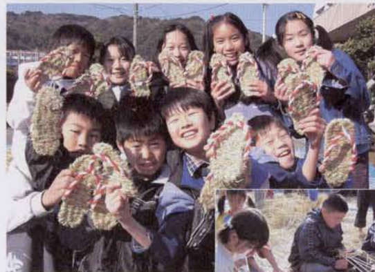
▲できあがったわら草履を手に記念撮影