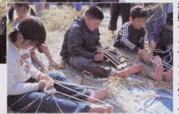
◀わら草履作りに挑戦する子どもたち