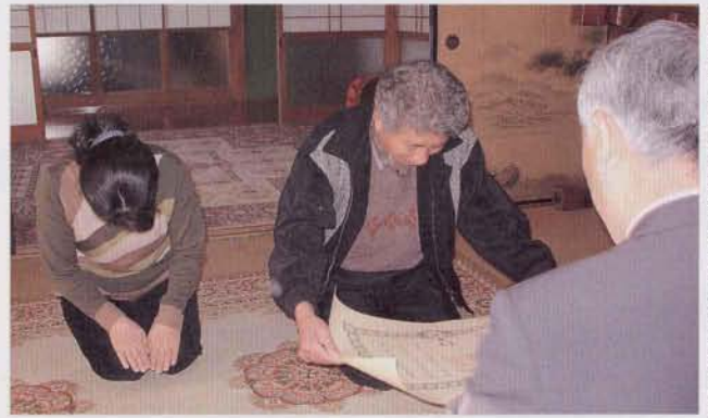
◀池田助役から遺族の方へ渡される勲記