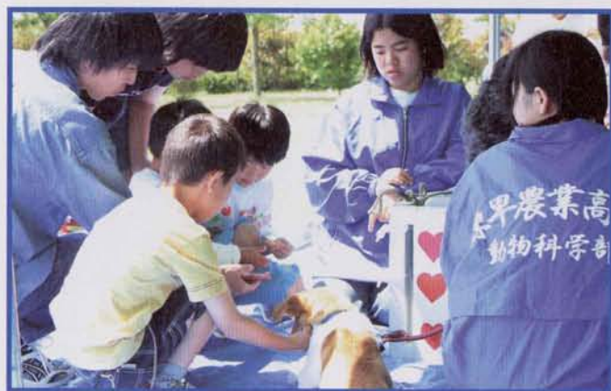
▲ふれあい動物園でエサを与える子どもたち