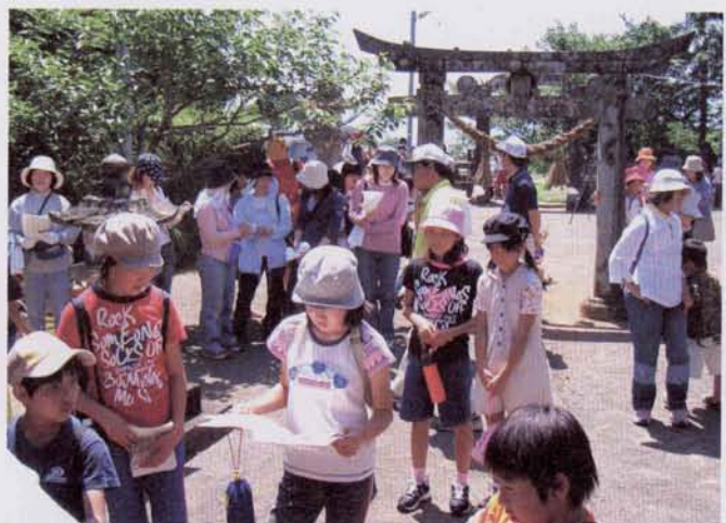
◀史跡についての説明を聞く皆さん

この活動は、中学生を持つ全世帯の保護者が、中学校周辺の交通量の多い交差点に、年間を通じて交替で立つように計画してあります。