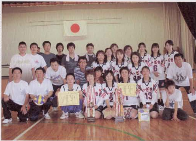
優勝した井崎地区の選手たち