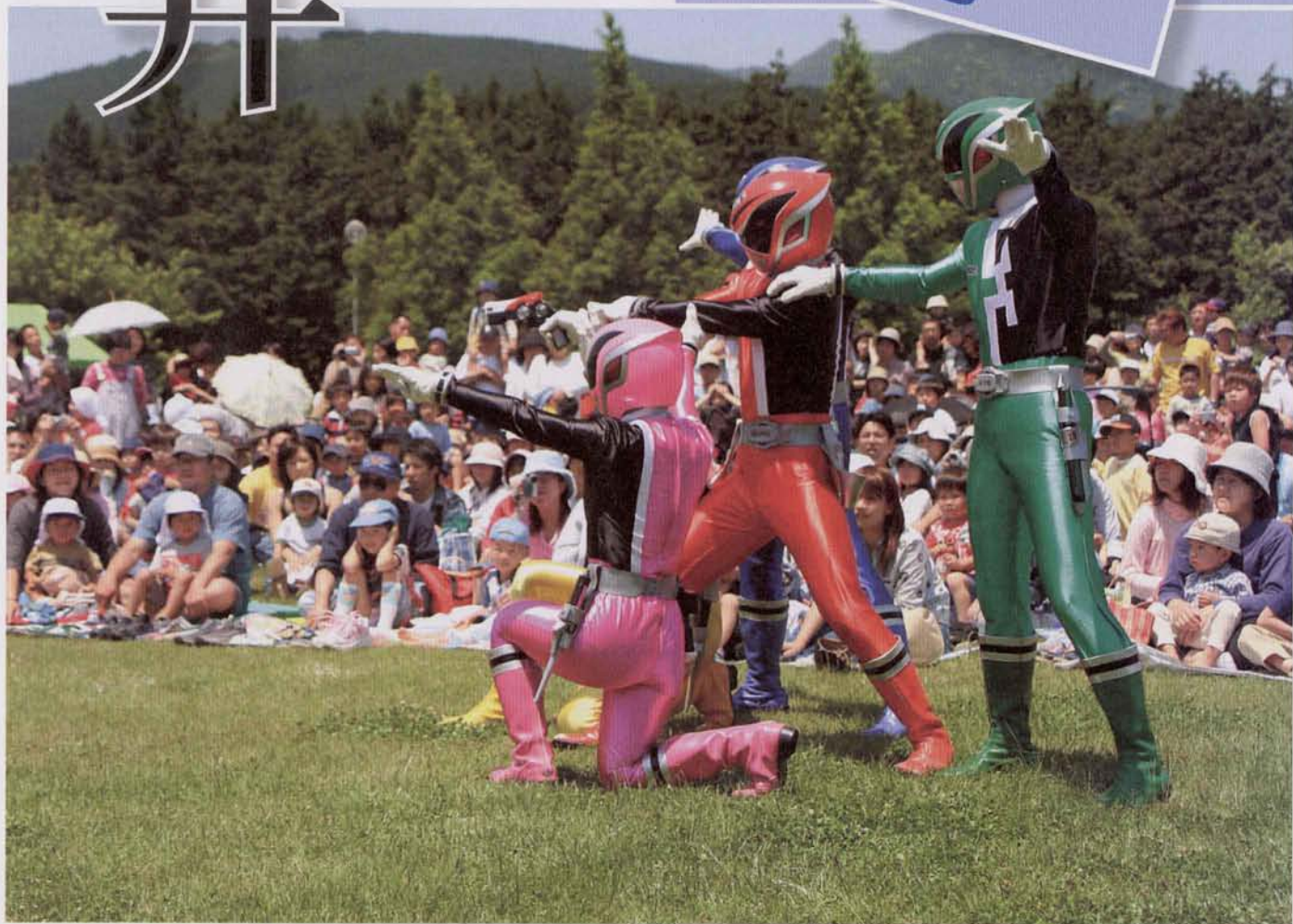
▲子どもたちに大人気のデカレンジャー