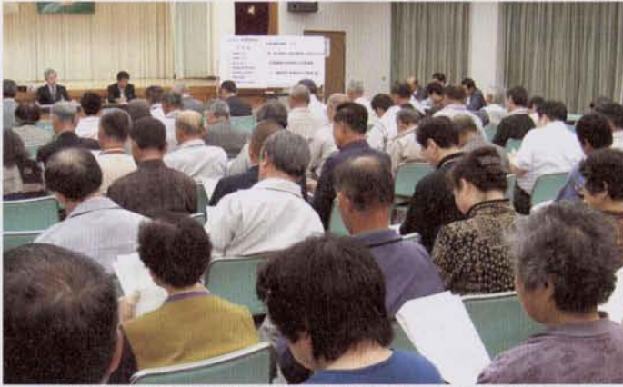
▲新市計画住民説明会の様子(4月15日、おがたま会館)

○(合併事務局)借金はいくらでも出るといふ訳ではないので、本来に必要な分については、特に旧市・町でのこれまでの計