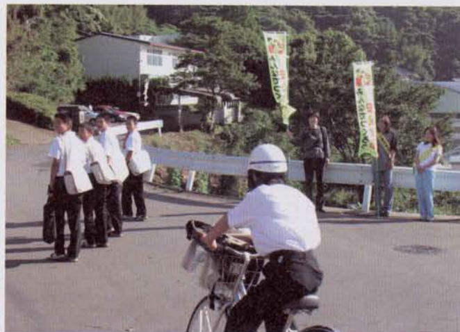
◀街頭指導をする保護者たち