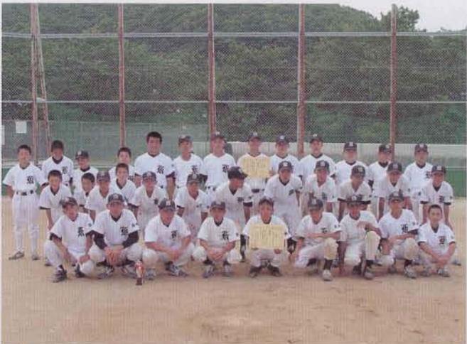
優勝・準優勝の中学校野球部の皆さん

今年も決勝戦には、男女ともに井崎が残り、男子は牧、女子は遠竹と対戦し、共にストレートで勝ち、男子は4年連続、女子も2年連続の優勝を果たしました。