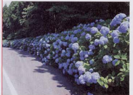
山茶花高原へ向かう道路沿いをきれいに彩る紫陽花 (みさかえの園上付近)