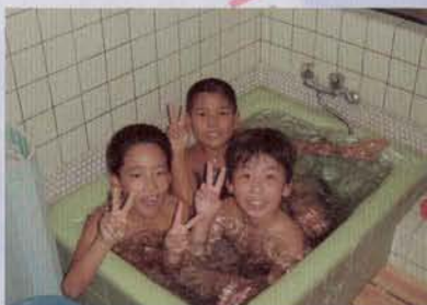
▲仲良くもらい風呂