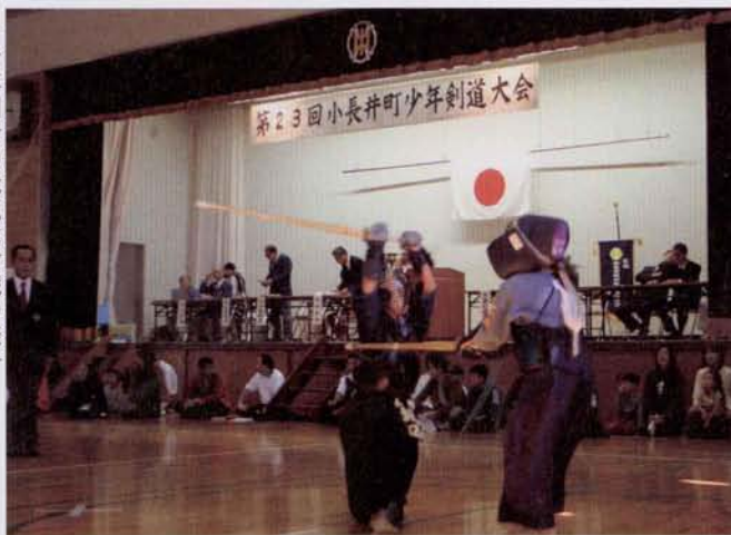
▶少年剣士の元気な対戦の様子