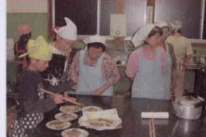
▲食事の準備では食生活改善推進員の皆さんに