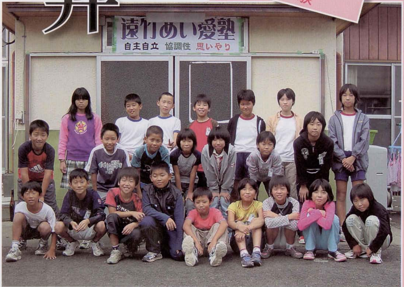
▲生活を共にした、23人の塾生たち