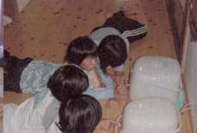
▲待ち遠しい炊飯の時間