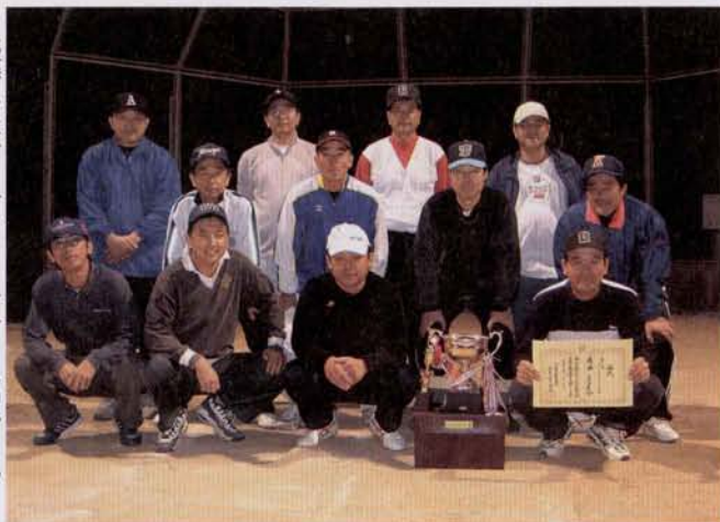
▶優勝したサーティーワンチームの皆さん