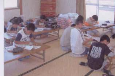
▲勉強もちゃんとした。