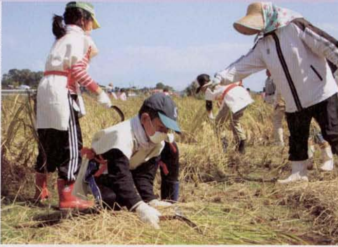
▶ 古代衣装の貫頭衣を身につけ稲を刈る子どもたち