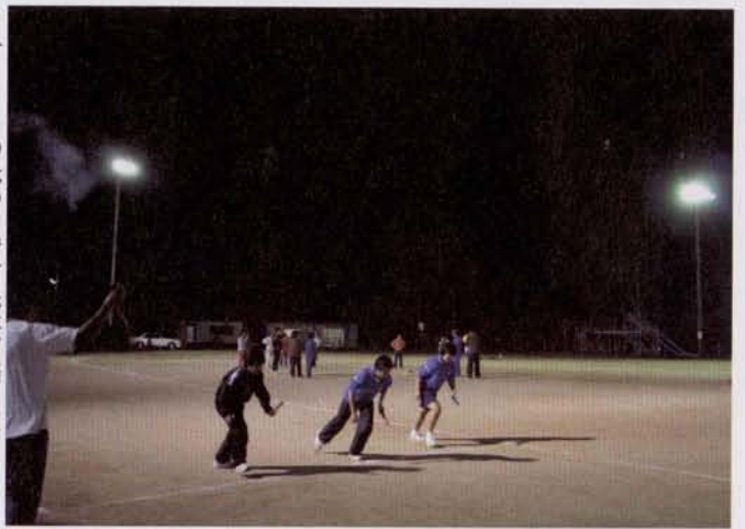
▶ ナイターの中で町民体育祭の練習をする区民

本町からもレギュラー3チームとジュニア1チームが出場し、小長井少年ライナースジュニアチームが見事、優勝しました。