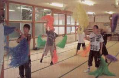
▲空き時間には町民体育祭の応援練習