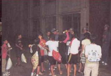
▲もらい風呂の引率では消防団員の皆さんに