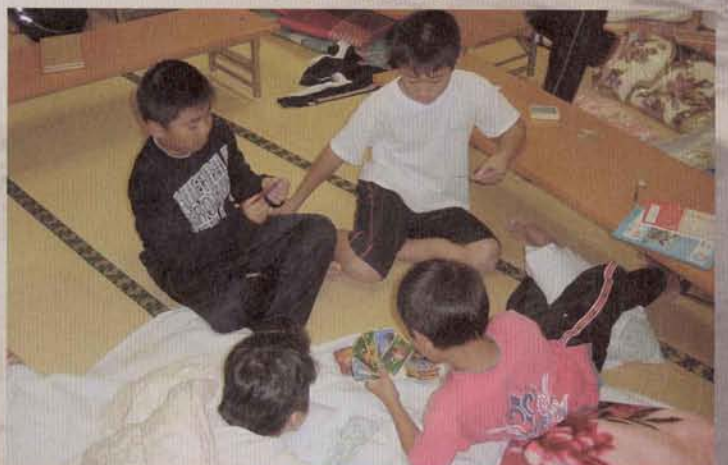
▲楽しかった自由時間