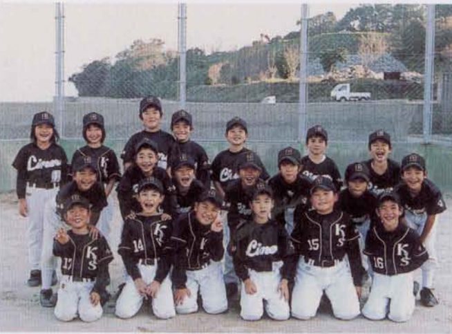
▶ 小長井少年ライナースジュニアの皆さん

赤米は各学校に配られるほか、山茶花高原ハーブ園で1袋(300g) 500円にて販売される予定です。