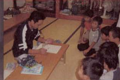
▲自由時間はPTAの人に