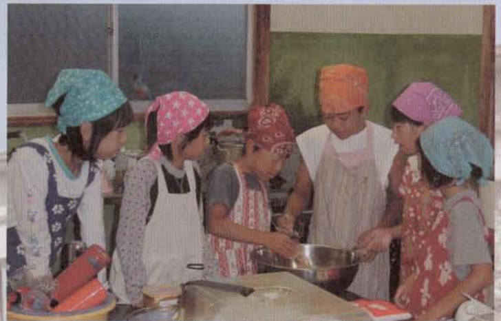
▲協力し合って夕食づくり