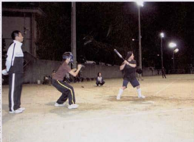
▶優勝した小川原浦チームの攻撃(初戦の対遠竹戦)