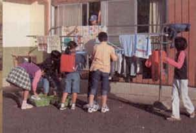
▲通学前の洗濯もの干し