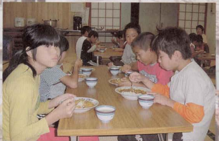
▲うん、これはうまい