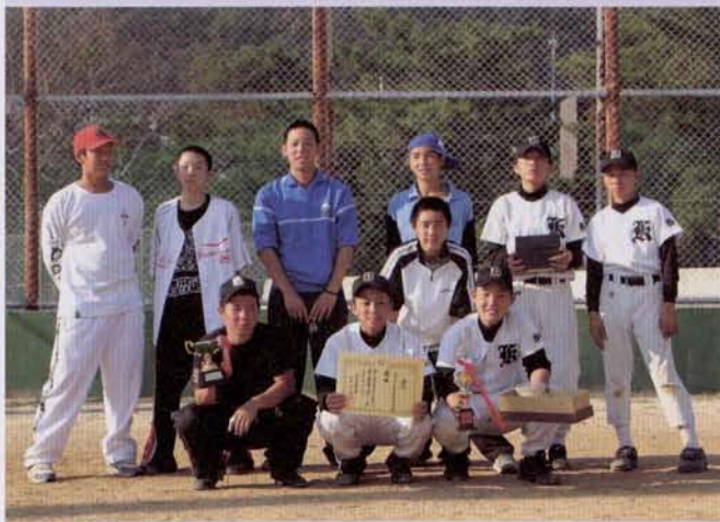
▶優勝した中学3年チームの皆さん