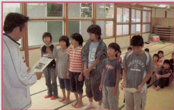
▲10月9日(土)、閉校式で修了証書を受け取る塾生