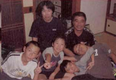
▲もらい風呂では近所のお宅の人に