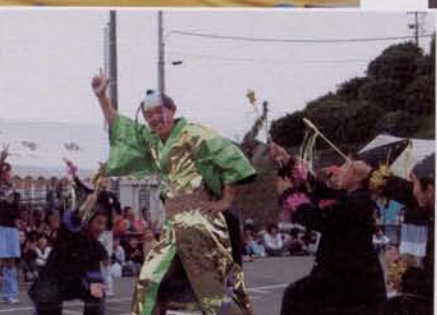
▶お楽しみ抽選会 ▶踊れや長つ子隊