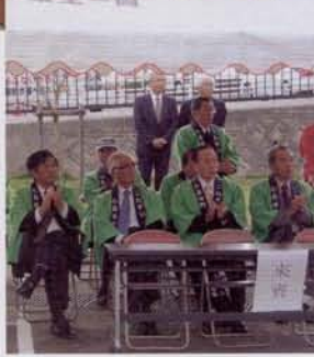
▶合併に関連したO×クイズ ▶一市五町からのご来賓