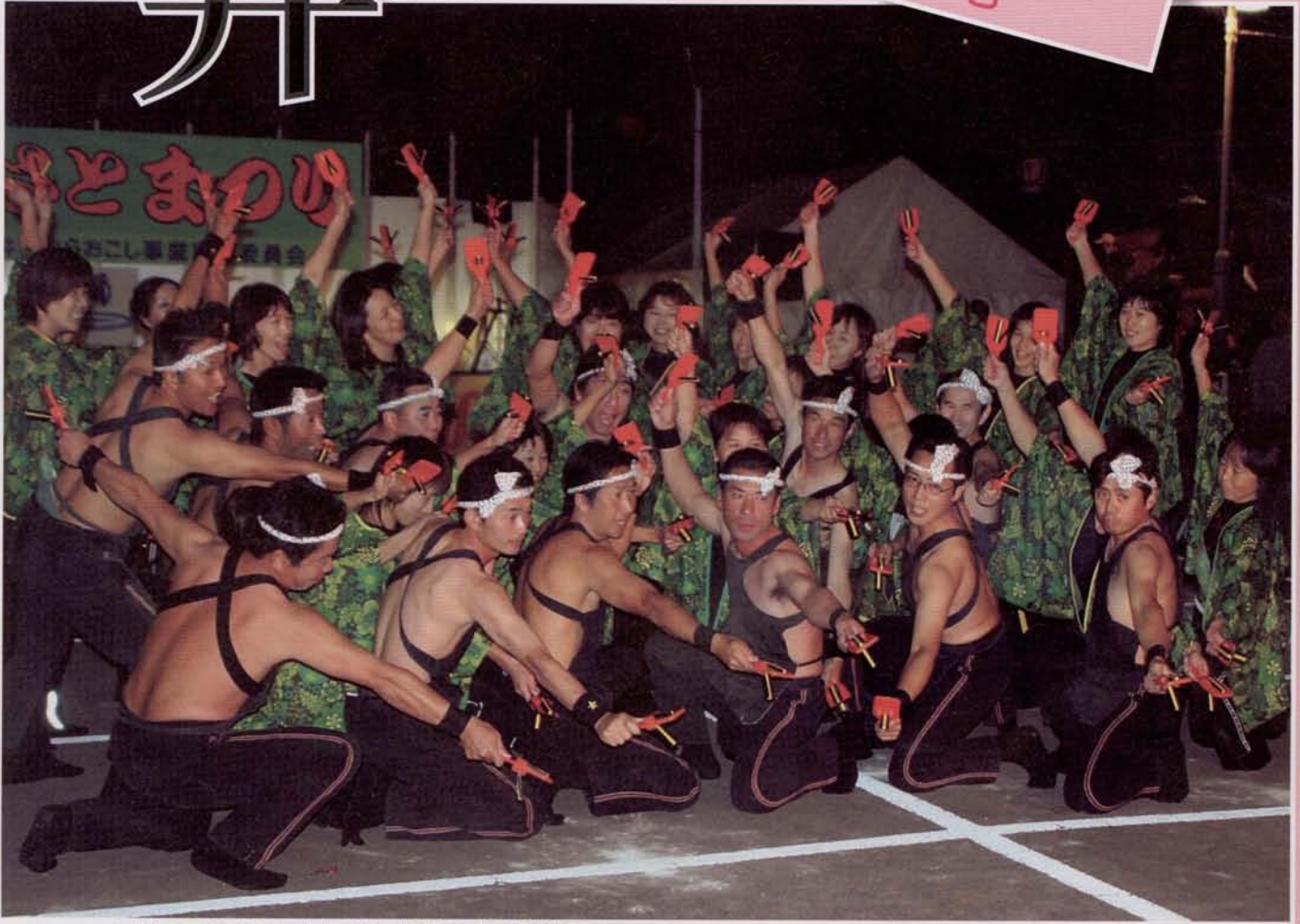
▲ダンスコンテスト大人の部、優勝の「遠竹夢組」