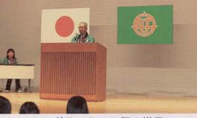
▲ボランティア祭の様子