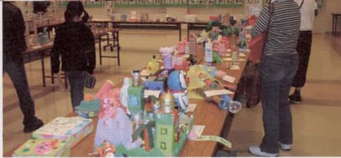
▲町展作品の展示会場