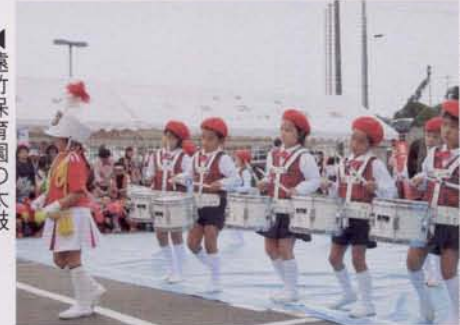
▶ふたば保育園の踊りと演奏