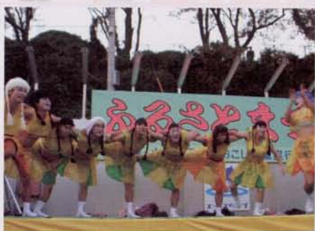
▶スラ引き大会 ◀おやジダンスマスターズ