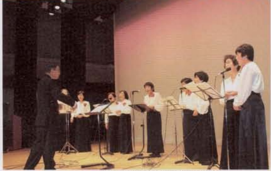
▲文化協会発表会の様子