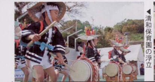
▶清和保育園の浮立