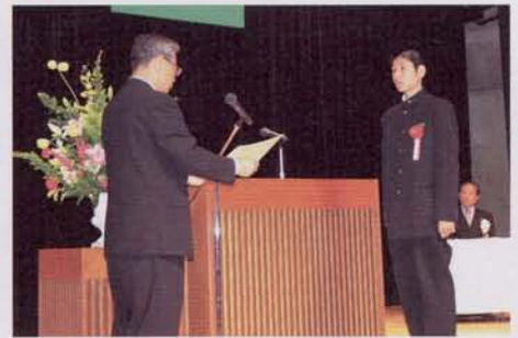
▲体育功労賞・スポーツ賞受賞の方々