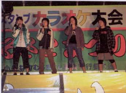
▶カラオケ大会の審査員 ◀カラオケを熱唱する出場者