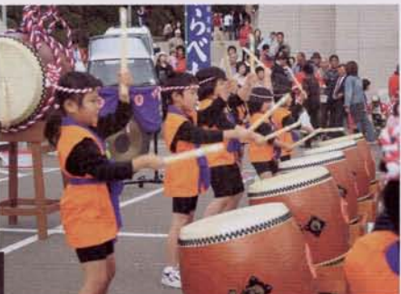
▶遠竹保育園の太鼓