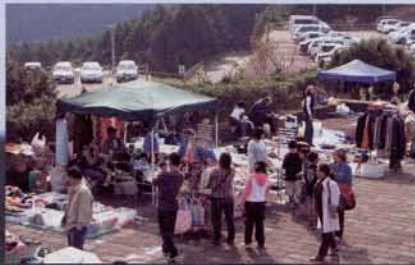
▲フリーマーケットもたくさん出店