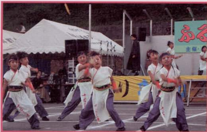
▲ダンスコンテスト子どもの部、優勝の「ハニーキッズ」