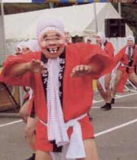
▶森山町のひよっこ踊り