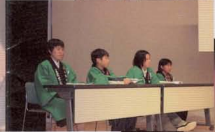
ボランティア祭の様子

ふるさとまつりは今年で第19回目を迎えました。まつり実行委員会では来年3月の市町村合併を控え、このまつりを来年度以降への布石となるような催しにするため、夜ごと関係者が集まり、協議を重ねました。 前夜祭をはじめ各種アトラクション、ショータイムの増強、ダンスコンテストの賞金アップや抽選会の景品内容の充実など数々の見直しや取り組みが行われ、例年以上に盛大なものとなりました。 当日は朝方に小雨が落ち、天候が心配されましたが、その後は持ち直し、絶好のまつり日和となりました。