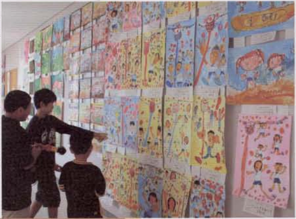
▶ホールに展示された町展作品

ふるさとまつりは今年で第19回目を迎えました。まつり実行委員会では来年3月の市町村合併を控え、このまつりを来年度以降への布石となるような催しにするため、夜ごと関係者が集まり、協議を重ねました。 前夜祭をはじめ各種アトラクション、ショータイムの増強、ダンスコンテストの賞金アップや抽選会の景品内容の充実など数々の見直しや取り組みが行われ、例年以上に盛大なものとなりました。 当日は朝方に小雨が落ち、天候が心配されましたが、その後は持ち直し、絶好のまつり日和となりました。