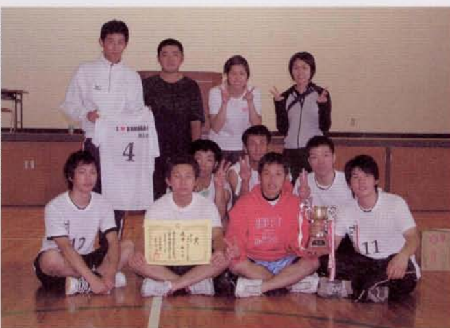
▶ 優勝した旅人会の皆さん