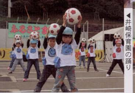
▶井崎保育園の踊り