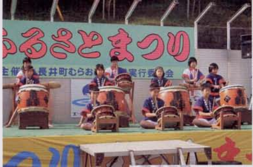
▶大盛況のもち投げ ▶高来町から轟太鼓