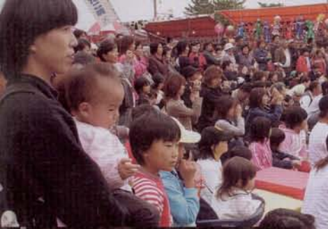
◀会場いっぱいのお客