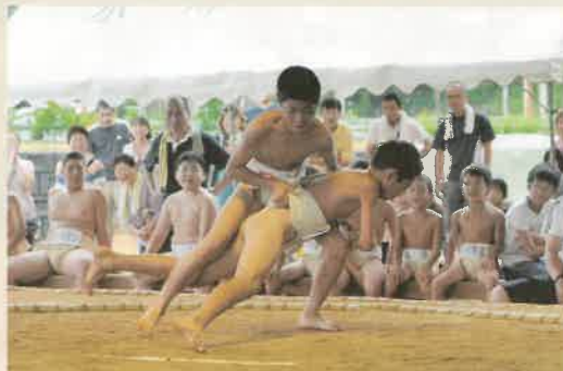
「まっ、まわしがくい込んでます～」

日時 平成二十五年八月二十五日(日) 行司 小長井町相撲部 場所 小長井相撲場 勸進元 こながい相撲大会実行委員会