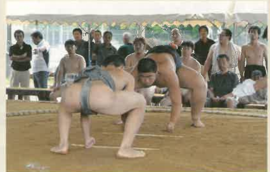
「笑った～ら負けよ、あつぷっぷ！」

「団体の部」は、「小・中学生の部」を全勝で小ヶ浦地区が、「一般の部」をこちら全勝で田原地区がそれぞれ制し、総合優勝に小ヶ浦地区が輝きました。その他「個人の部」の主な結果は、上記番付表のとおりです。