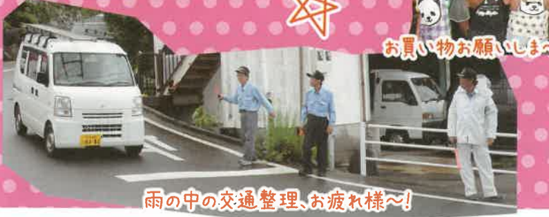
雨の中の交通整理、お疲れ様〜!

8月25日(日)は、午前の相撲大会の後、午後からは「第28回こながいまつり」が開催されました。今年にはインターネット動画サイト「ニコニコ動画」のイベント「ニコニコ町会議」を同時開催。大雨の天気にもかかわらず、朝早くから中高生を中心に若者が続々と小長井入りし、文化ホール内を中心に、いろんなイベントが開催されました。遠くは関東からの参加者もあり、約7,000人もの来場者を迎え、大盛り上がりとなりました。夜8時過ぎ頃には奇跡的に雨が止み、花火が小長井の夜空を飾り幕を下ろしました。