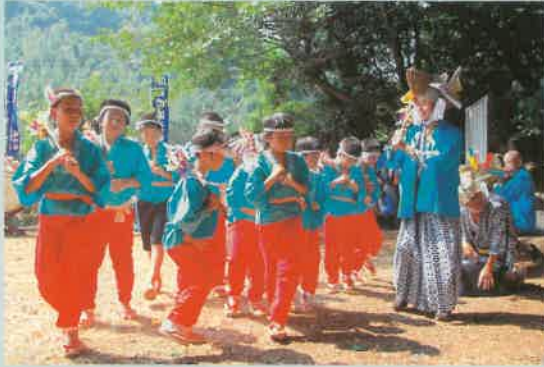
は〜い元気よ〜く踏んで踏んで〜

児童たちは「アイヨオー」の掛け声のあと栗を踏む格好で、右に左にと威勢よく押し合いを繰り返していました。