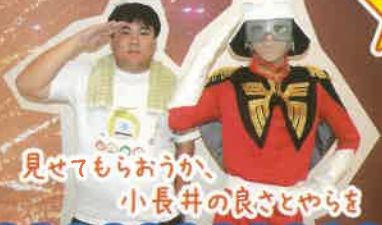
見せてもらおうか、小長井の良さやま