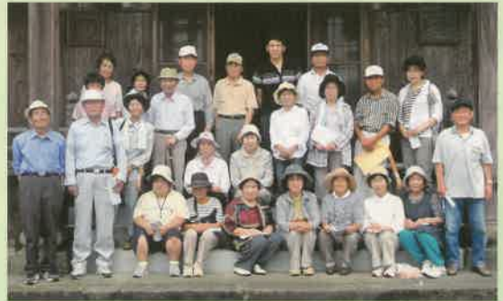
参加者全員で記念撮影 (浄真寺にて)