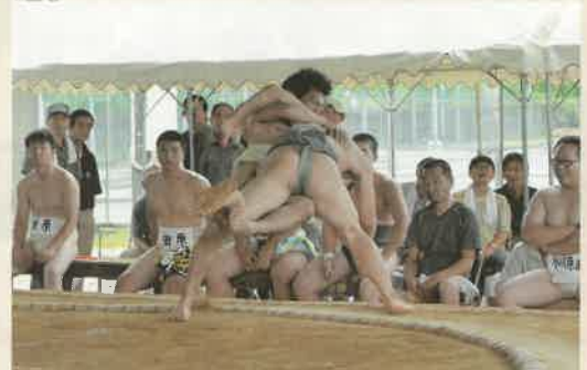
土俵下へ落ちる両力士。この勝負は？