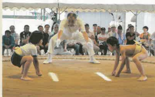
「さあ、見合って！見合って！」

押し相撲で勝利するなど、なでしこ力士も大活躍！今年も数々の好取組があり、会場は雨を吹き飛ばすほどの熱気につつまれました。