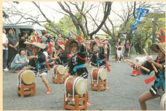
今年も見事な奉納踊りをみせてくれた清和保育園の園児たち