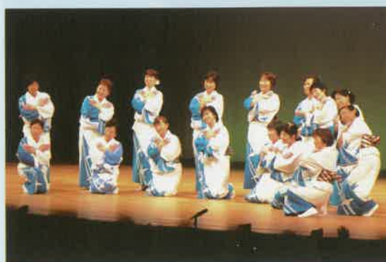
「やっと終わった！」最後はホッとした表情で

猛練習の成果もあり、見事な「小長井音頭」を披露。失敗も無く、最後もにっこりとした表情で演技を終えました。