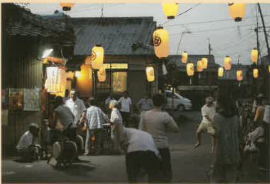
たくさんの参詣人でにぎわった井崎の観音さん