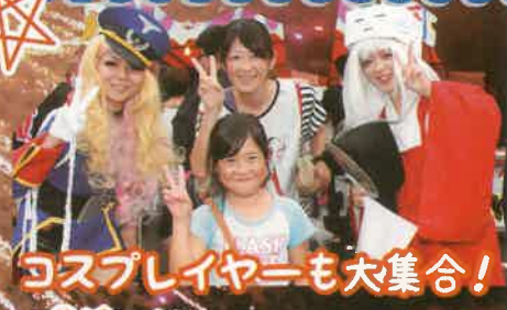
コスプレイヤーも大集合!