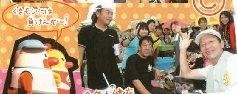
くまモンには負けんぞ〜!