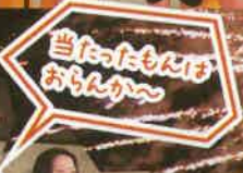
当たったもんはおらんか〜