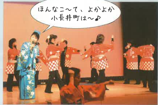
最後は「小長井音頭」の総踊りで盛り上がりました。

小長井町讃歌「坂のまち夢のまち」と「小長井音頭」の生の歌声が、昭和61年11月の町制20周年記念式典以来、久しぶりに小長井町に響き渡りました。