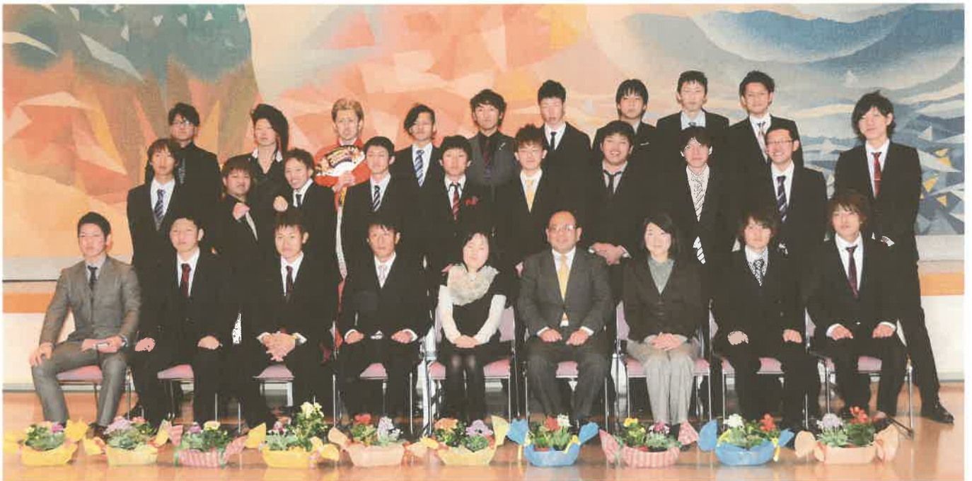
凛々しい面々の男子成人者

山山矢村水松牧福馬橋野中土竹田島古黒梅石池池 本口竹永口本山井場本副村居田川田賀田野橋田田 春ひ真 奈夏久美成真美和菜干さかれ香真風 安 かり美茜子純希美理咲美美華らん菜璃亜子雅恵莉