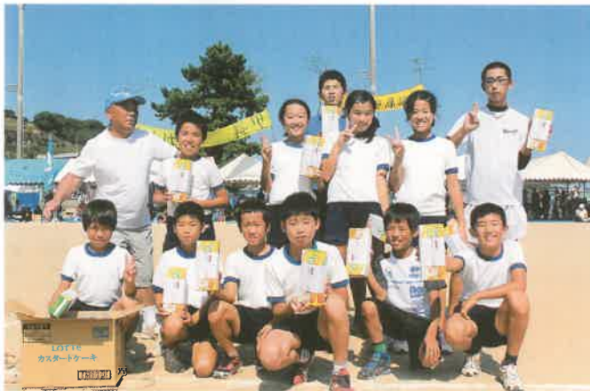
「やったぜ!!」賞品もらって大喜びの長里チーム

競技結果は、長里地区が総合の部・男子の部・女子の部の全部門を制覇し完全優勝を果たしました。