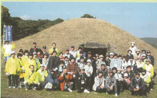
参加者全員「鬼塚古墳」で記念撮影

ゴール後は食生活改善推進員さんによる、健康を考えちょっとうす味の郷土料理「ぬっぺ汁」が振る舞われました。