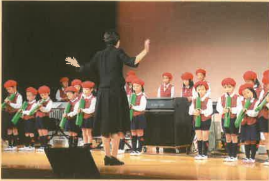
ふたば保育園園児によるオープニングの合奏