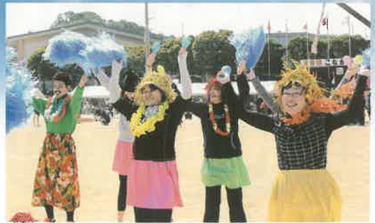
「牧いるクローバーズ」登場～!!

新種目として「スプーンリレー」がお目見えし、玉入れや地区対抗リレーなどで汗を流し、地域の親睦を深めた1日となりました。