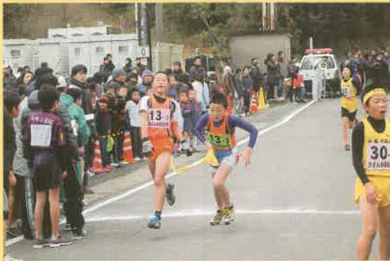
1区から2区へのタスキリレー (力走する遠竹JRC男子チーム)

今年も市内外から85チーム425名が集まり、沢山の声援を受けながら山茶花高原周回コースを力走しました。