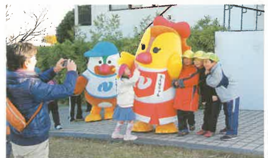
「がんばくん」と「らんばちゃん」も応援にかけつけました。

参加者には「たらみゼリー」や「田原のいもんこ」がプレゼントされ、小長井を満喫できた大会となりました。