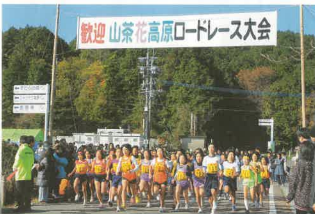
スタートをきる小学5年女子