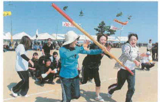
「棒を振り回す競技ではないですよ～」田原チーム