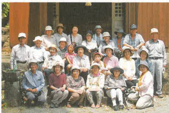
参加者全員で記念撮影（諏訪神社にて）

真夏の当日は26名の参加者が集まり、「目島神社」を出発し、「諏訪神社」まで小ヶ浦・井崎・遠竹地区の7ヶ所の史跡をめぐりました。