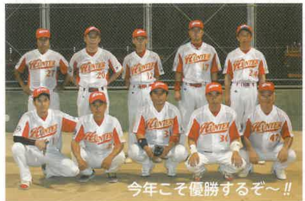
今年こそ優勝するぞ～！！

毎週金曜日の夜、小長井グラウンドで猛練習中。差し入れ大歓迎。練習よりも、作戦会議で円卓を囲むのが大好きな「小長井ハンター」、小長井の皆さん、応援をよろしくお願い致します。