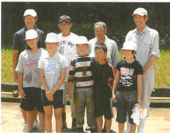
柳新田のおじさんと記念撮影（遠竹小5年のみんな）