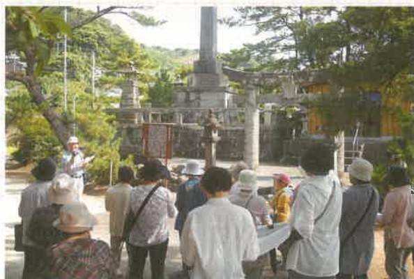
解説に聞き入る参加者（目島神社にて）