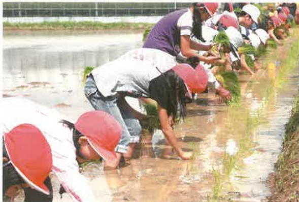
腰は痛くならなかったかな？

6月28日(火)、町内3小学校5年生43名の児童たちが、「古代赤米」の田植えに挑戦しました。