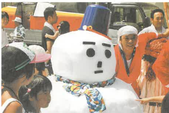
昨年の「こながいまつり」の様子