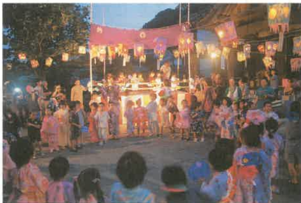
7/31 ふたば保育園盆おどりの夕べ

夏まつりでは、各会場とも、浴衣姿などの多くの人で賑わい、涼しくなり始めた夕暮れ時にぼんぼりに明かりが灯され、盆踊りなどで盛り上がっていました。