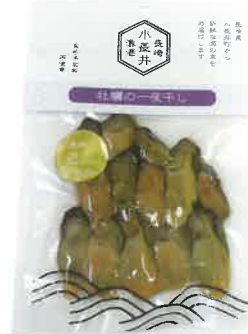
新商品の「一夜干し」