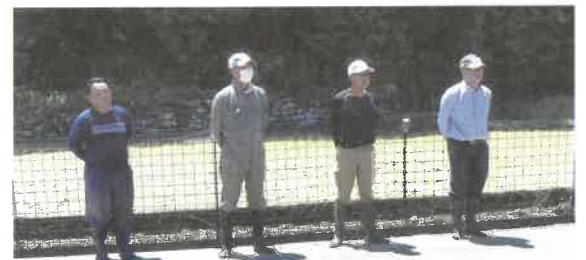
お世話になった組合の皆さん