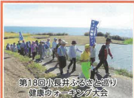
第18回小長井ふるさと巡り健康ウォーキング大会

10月4日(日)、小長井グラウンドで「第16回こながい体育祭」が行われます。(実施の可否未定) お遊戯や玉入れ、綱引き、地区対抗リレーなど、園児からお年寄りまで楽しい種目が揃っていますので、地域の皆さん揃って参加して、健康づくりと地域の親睦を深めましょう。詳しくは小長井支所内の実行委員会事務局まで(TEL 0957-34-2111)