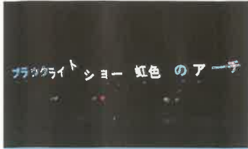
ブラックライトショー 紅色のアーチ