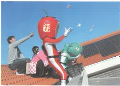
12月12日(土) ふたば保育園の餅まきにフルーツレンジャー登場