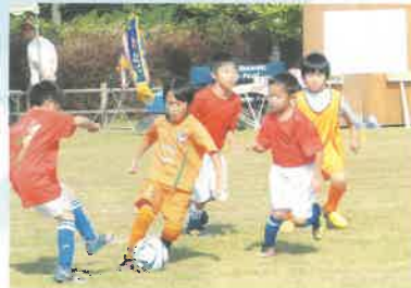
大人顔負け！スーパープレー

12月23日祝、恒例の小ヶ浦巳の日奉納相撲が藤原神社で開催予定でしたが、あいにくの雨……。まさに泣く泣く取り組みは取りやめになりました。しかし、そこは不屈の小ヶ浦魂、おでんにぜんざい、おにぎりなどの振る舞いに、会場周辺は熱気ムムムンでした。