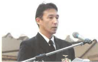
海上自衛隊大町海将補

戦後70年：日米合同追悼式 今を遡ること71年前の昭和19年11月21日、多良山麓上空で旧日本軍と米軍の激しい戦闘があり、米軍のB-29爆撃機を零式戦闘機が撃墜、その後B-29は小長井沖に、零式戦闘機は高来町山中に墜落、尊い若者の命が散りました。戦後70年を経た今、地元の有志の皆さんによりその国籍を超えた「日米合同追悼式」が、小長井小学校近くの鎮魂碑と高来町山中の慰霊碑で厳かに行われられました。式には県知事(代理)、諫早市長を始め自衛隊や米軍からもご出席いただき、あの悲劇を二度と繰り返さないという確固たる思いが伝わってきました。