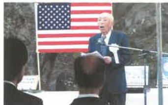
式辞を述べる犬尾会長