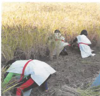
むむっ! 古代人現る……?