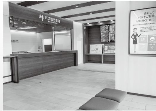
▲バス待合所・総合案内 (iisa1階) ※諫早バスターミナルが移転します