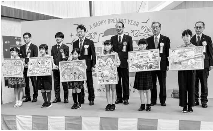
▲「新幹線とまちづくり絵のコンクール」表彰式