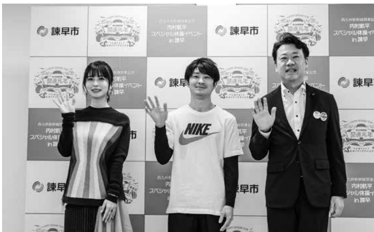
▲開業記念「内村航平スペシャル体操イベント in 諫早」