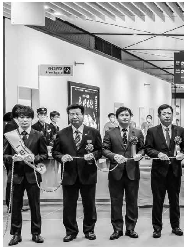
▲諫早駅で行われた開業式典・新幹線改札前でのくす玉開き