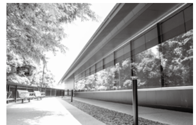
諫早の美術や歴史のことは