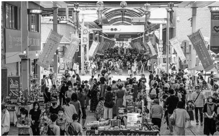
▲3日間、多くの人出で賑わったアエル中央商店街