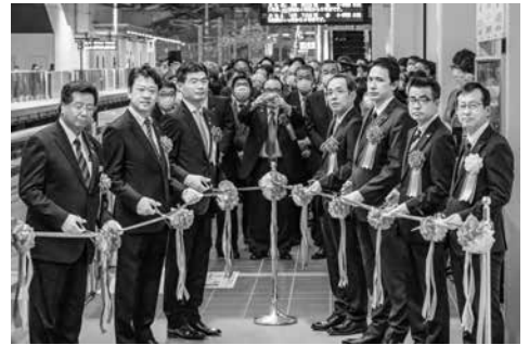
▲新幹線ホームでのテープカット