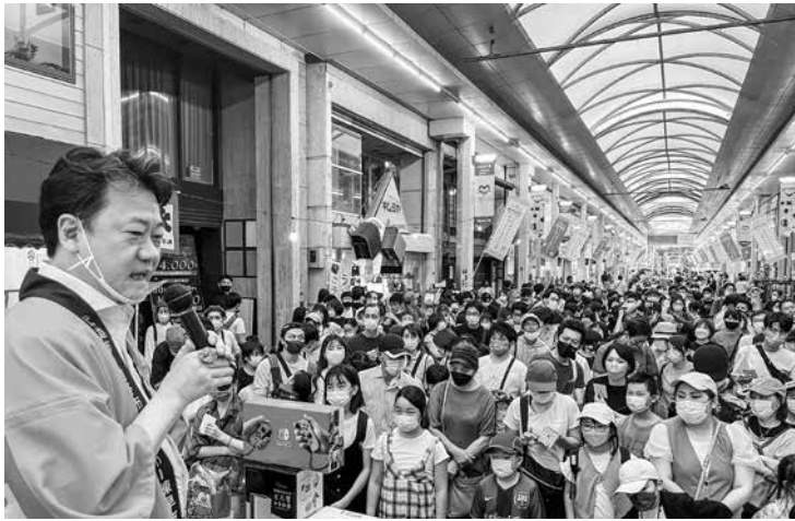
▲盛り上がった新幹線開業イベント