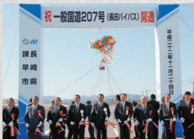
一般国道207号長田バイパス開通