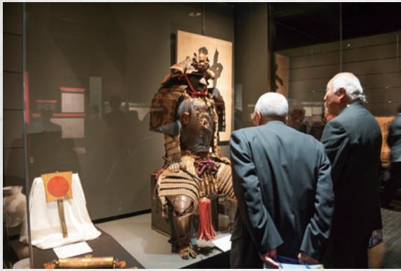
諫早市美術・歴史館オープン