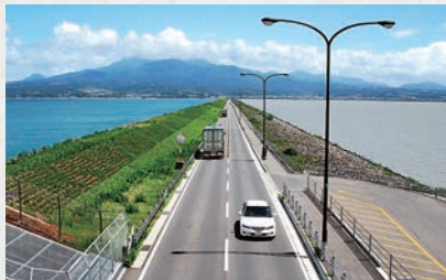
諫早湾干拓堤防道路供用開始