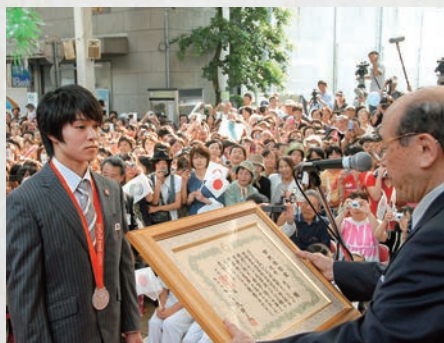
内村航平選手に市民栄誉賞授与