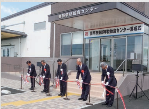
東部学校給食センター完成