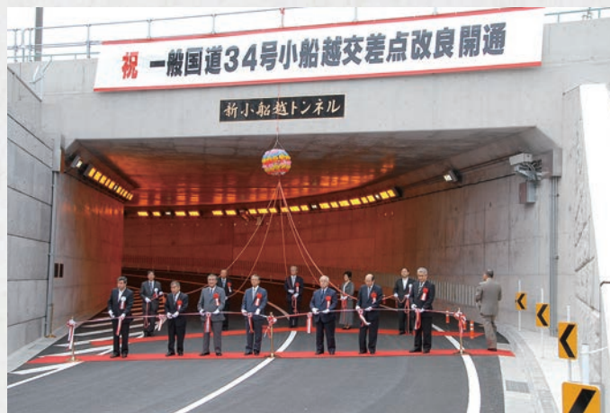
小船越交差点開通