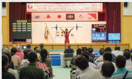
全国高総体(ウエイトリフティング)

中央体育館(内村記念アリーナ)供用開始 県立総合運動公園陸上競技場供用開始 V・ファーレン長崎ホーム開幕戦を 県立総合運動公園陸上競技場で開催