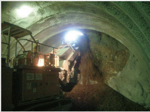
九州新幹線鈴田トンネル貫通