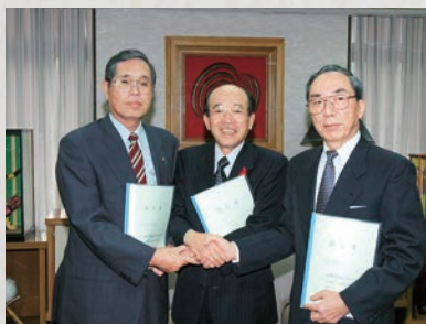
諫早市こども準夜診療センター調印