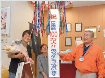
いもり月の丘温泉入場者100万人突破