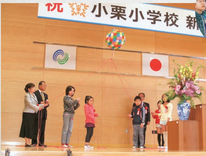
小栗小学校新校舎落成