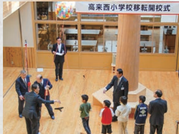
高来西小学校開校