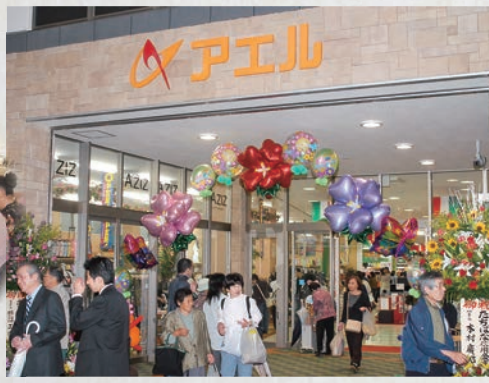
アエルいさはやオープン