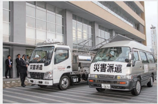
東日本大震災給水車派遣