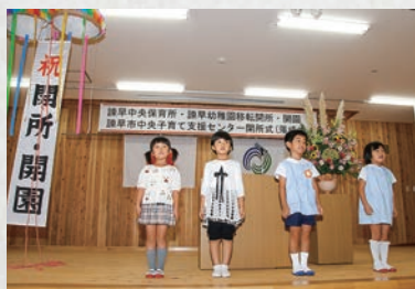
諫早中央保育所・諫早幼稚園 開所・開園