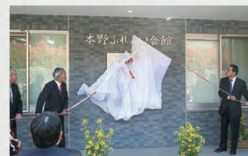
本野ふれあい会館落成