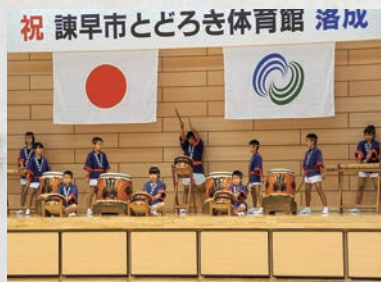
とどろき体育館落成