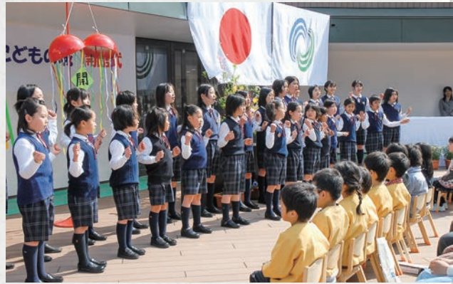
こどもの城オープン