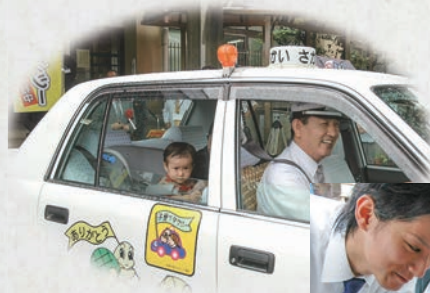
子育て支援タクシー