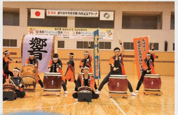
諫早市中央体育館落成