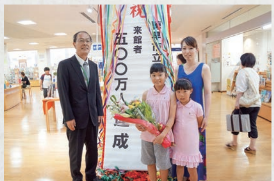
諫早図書館入館者500万人達成