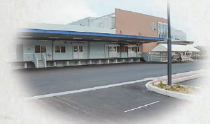
西部学校給食センター