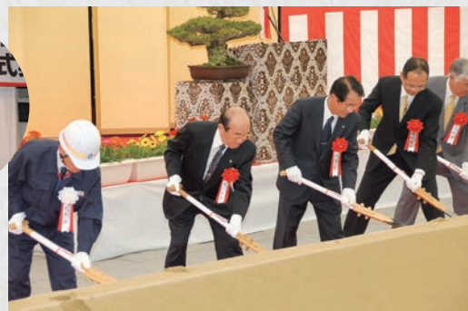
九州新幹線西九州ルート起工