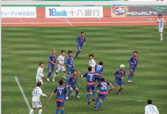
V・ファーレン長崎ホーム開幕戦(対ガンバ大阪戦)