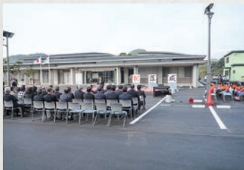
飯盛ふれあい会館落成