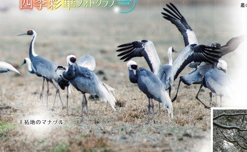
干拓地のマナヅル