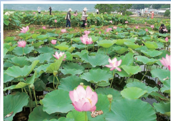
唐比湿地公園（唐比ハス園）