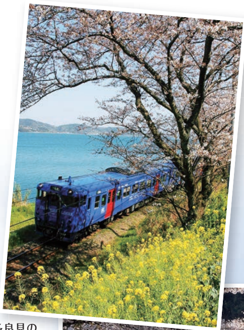
多良見の 古川の桜