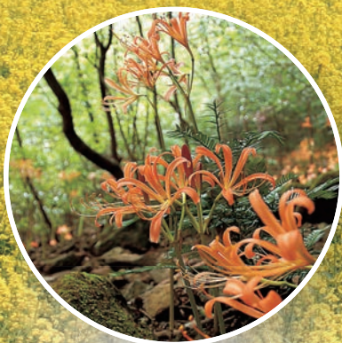
多良岳の オオキツネノカミソリ