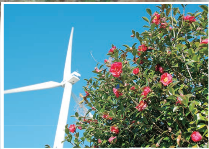
山茶花高原ピクニックパークのサザンカ