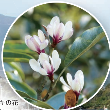
オガタマノキの花 小長井のオガタマノキは 国の天然記念物です。