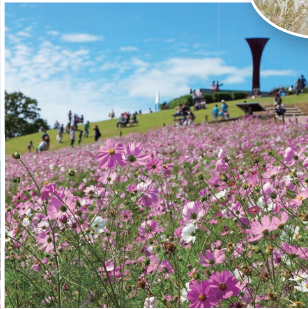
白木峰高原のコスモス