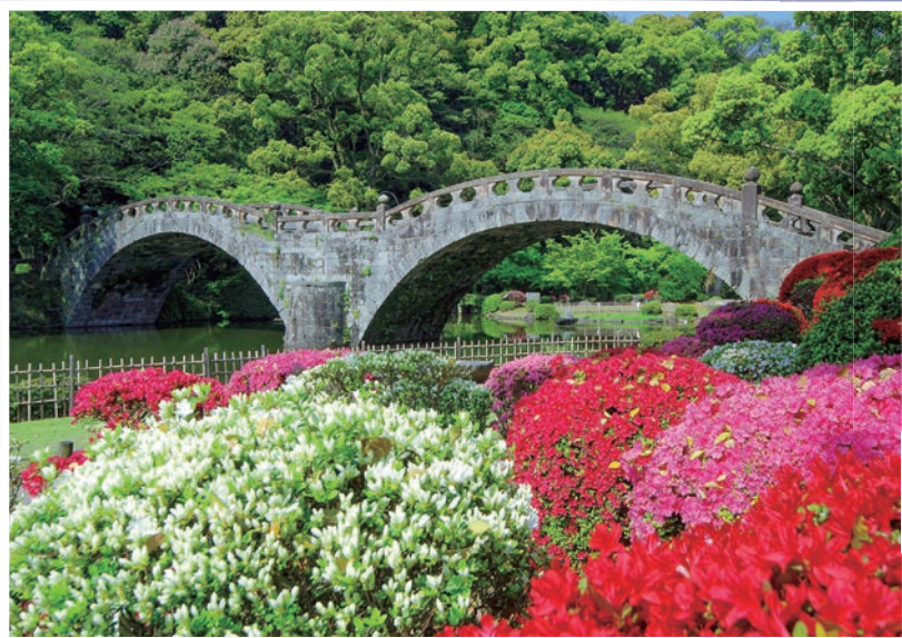
つつじと新緑の諫早公園・眼鏡橋