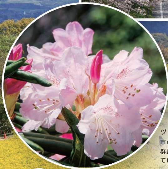
ツクシシャクナゲ 市の花・多良岳ツクシシャクナゲ 群叢は国の天然記念物に指定されて います。