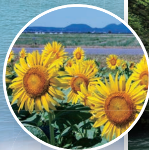
中央干拓地の ひまわり