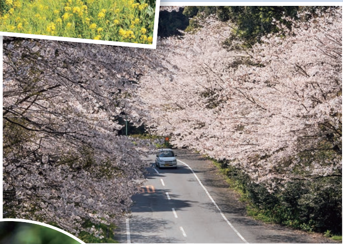
森山の桜のトンネル