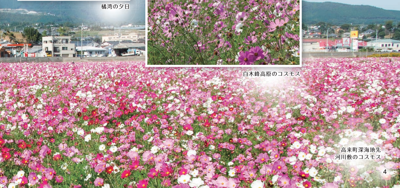
高来町深海地先 河川敷のコスモス