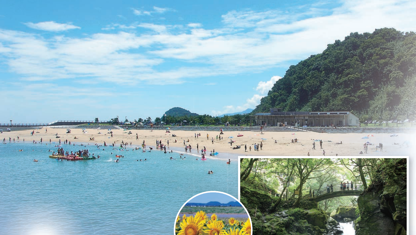
結の浜マリンパーク