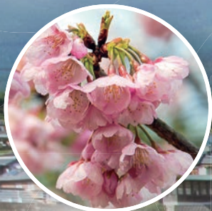
諫早公園の大寒桜