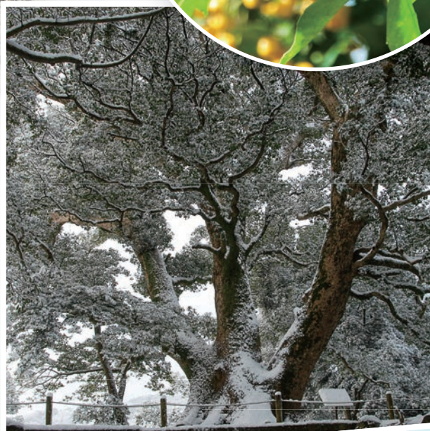
諫早公園の大クス