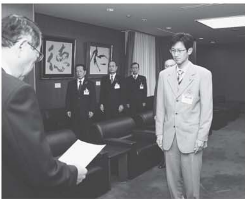
辞令を受ける派遣職員