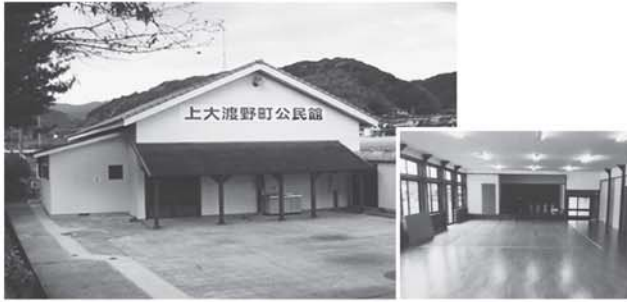
上大渡野町公民館（外装内装など改修）

上大渡野町自治会は、宝くじの普及広報を目的に行われている（財）自治総合センターのコミュニティ助成事業を活用して、公民館を整備（改修）しました。（市地域振興課）