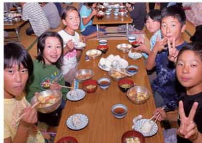
皆そろっていただきまーす