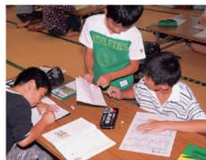
分からないことは上級生に教えてもらいます