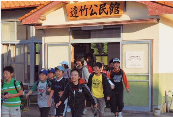
朝、公民館からの通学 みんなで元気よく“行ってきま～ず”