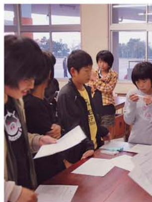
朝の健康管理も大切です