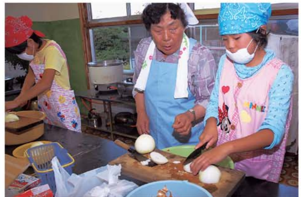
食生活改善推進員さんに教えてもらいながら夕食の準備