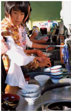
後片づけも自分たちで何事も体験です