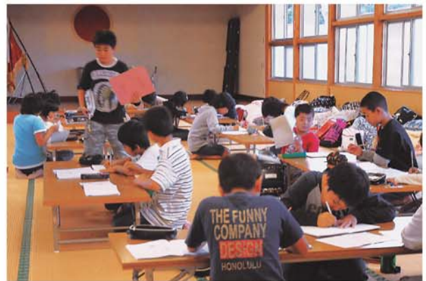
時間の空いた子どもたちから自主的に勉強を始めます。「今日の宿題は多かたさ」と子どもの声