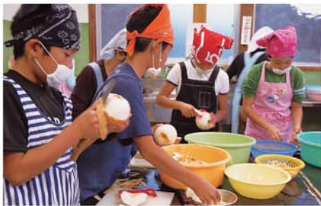
男の子も上手になりました

日常生活とは違う通学合宿 子どもたちは、約束を守り、時間を守りながら「ひとりではみんなのために、みんなはひとりのために」を考えての生活でした。 自ら参加した通学合宿。子どもたちは、掃除や朝夕の食事づくりなど一生懸命取り組みました。失敗もありましたが、地域の皆さんにもお世話になり多くのことを学びました。 この通学合宿で学んだ体験が、日常生活に活かされることを、保護者やPTA、地域の皆さんも願っています。