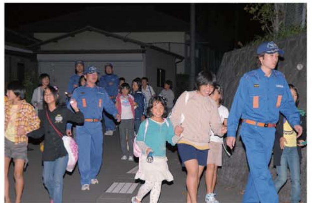
消防団員の皆さんに引率されてのもらい湯 夜道も安心して行けました