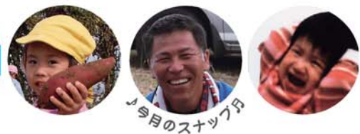
今月のスタッフ月