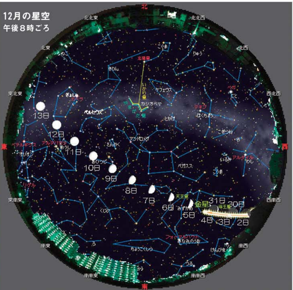
【星図は株式会社アストロアーツのステラナビゲータを使用しました】