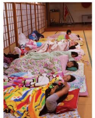
楽しすぎて眠れるかな～

10月23日、塾長や保護者、ボランティアの皆さんが集まり、通学合宿の反省会が開かれました。 実施時期や宿泊日数、献立、ボランティアのかかわり方などについて協議され、トイレ掃除や4日目の朝食は6年生に任せるなど来年に向けた意見が出されました。