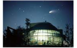
コスモス花宇宙館 白木峰町828-1(☎23-9003)