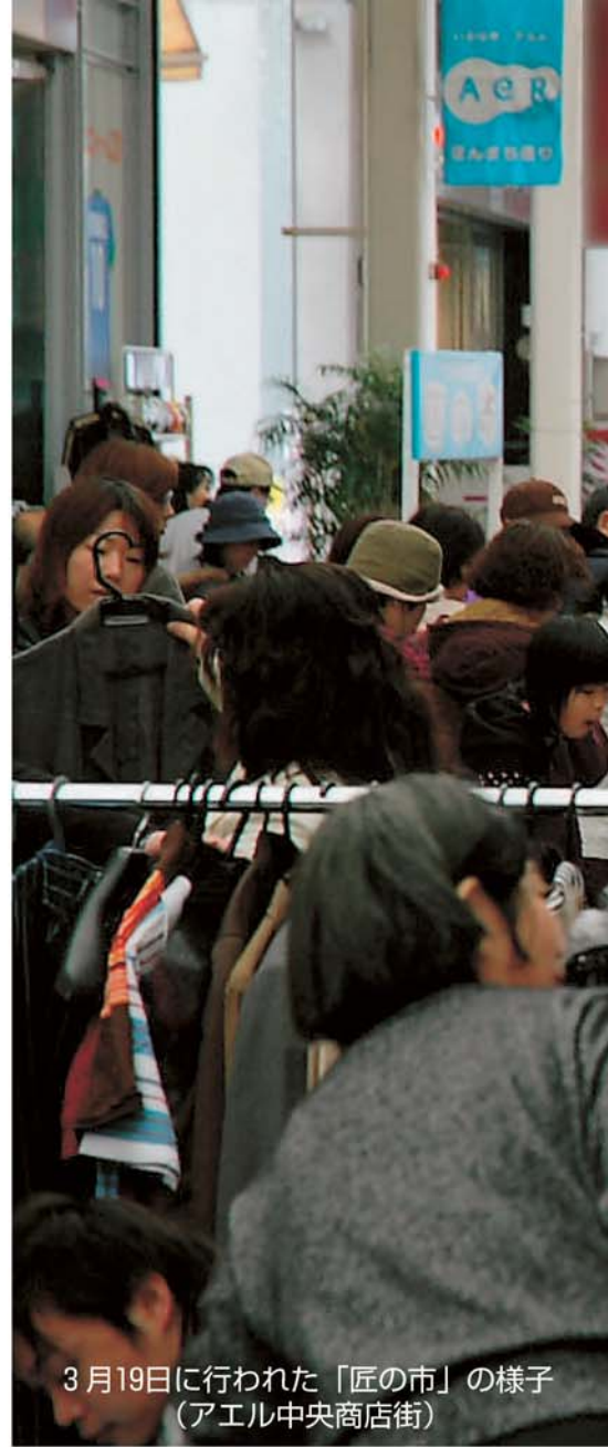
3月19日に行われた「匠の市」の様子 (アエル中央商店街)

国勢調査の人口をベースに将来推計人口を調査している国立社会保障・人口問題研究所の調べでは、今後は、高齢者（65歳以上）人口が増加する一方、総人口については、減少するとの予測が出されています。