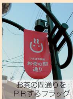
お茶の間通りをPRするフラッグ

永昌東町商店街では、平成14年度に「まちのデザイン(個店、町並み)」や「まちの運営(サービス、組織)」などを中心とした独自の「まちづくり協定」を締結し、高齢者を中心に顧客拡充のためのイベントの継続など、毎年新しい試みを自発的に実践し、活性化へ向けた取り組みを行っています。