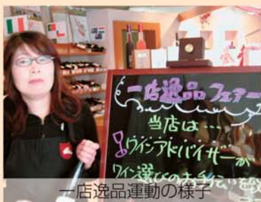
一店逸品運動の様子

それぞれのお店が個店の持つ個性を磨き上げ、消費者に自信を持って薦められる逸品創りに取り組み、他にはない付加価値の高い商品やサービスを提供することで「おもてなしの心」が伝わる商店街を目指しています。