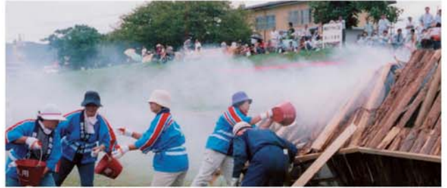
（主催：諫早市 協賛：国土交通省、長崎県）

救急救命講習、地震体験コーナーなどもありますのでいざというときに備え、市民の皆さんもぜひご参加ください。（市総務課）