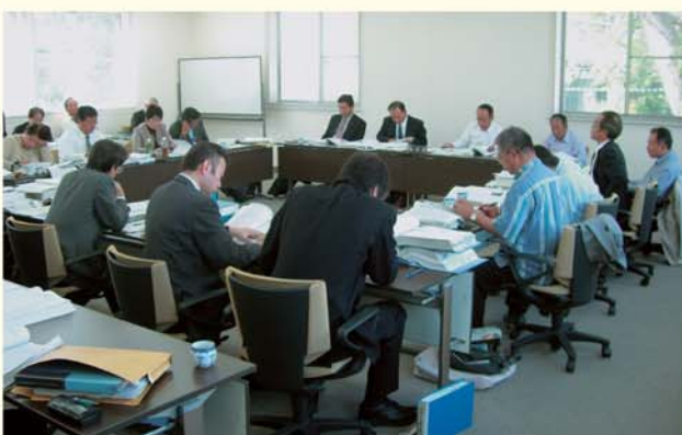
決算審査特別委員会開催風景