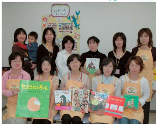
11月1日定例会でのチューリップさん