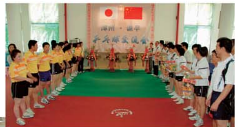
▲漳州市卓球協会選手と諫早市卓球協会選手