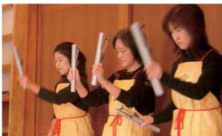
トーンチャイムの演奏