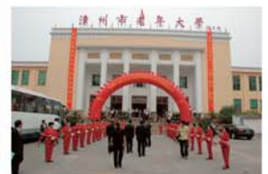
▲漳州市老年大学にて