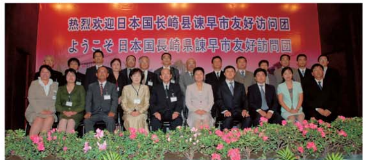
▲熱烈な歓迎を受けた諫早市友好訪問団