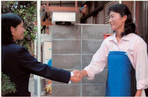
お母さんと握手をする四女のころころさん

そしてもうひとつ、才木家に初めてのお子さんが生まれて以来、25年間続いているのが「家庭の夕べ」です。週に一度、家族全員で1時間、家族のこれからの計画や読書の感想を話したり、ゲームをしたりした後、手作りのおやつをいただきます。こうして家族一緒に楽しい時間を過ごすだけで、お互いをわかりあい、何でも話せる雰囲気自然とできました。さすがにぎやかで楽しそうですね！