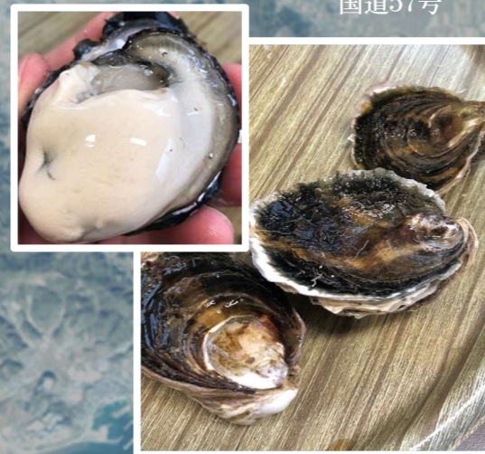
産地化を目指す「諫早湾岩ガキ」