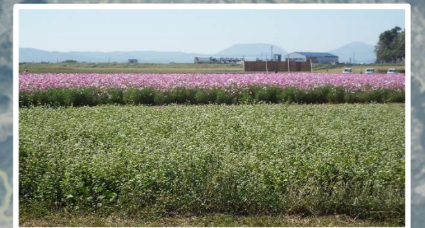
干陸地(本明川河川敷)を利用した特産『幻の高来そば』と『コスモス』