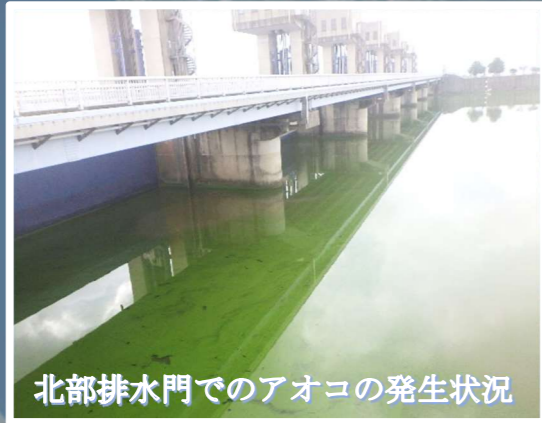
北部排水門でのアオコの発生状況

国営諫早湾干拓事業開門問題の早期終結及び環境改善、諫早湾を含む有明海の再生等の推進について