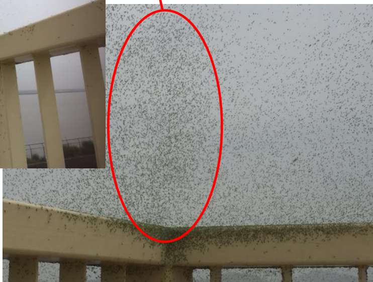
潮受堤防でのユスリカ（蚊柱）の発生状況