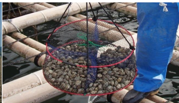
新たな方法で養殖した小長井町漁協の『垂下 式ゆりかごあさり』