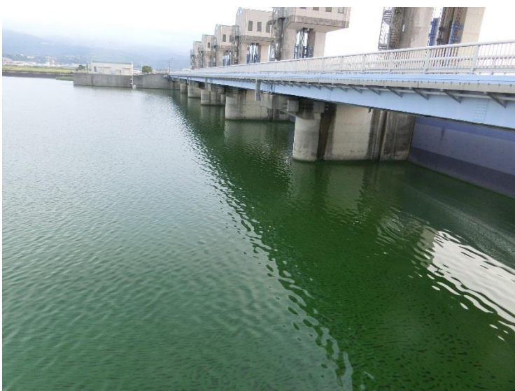
北部排水門でのアオコの発生状況