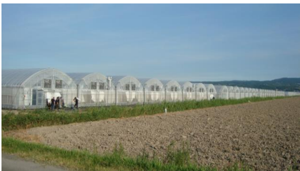
強い農業づくり交付金事業により整備した ミニトマトハウス