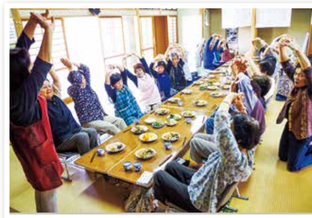
ふれあいいきいきサロン