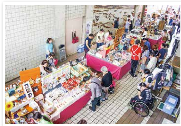
ナイスハートバザール in 諫早

また、障害のある人の社会参加を促進するための様々な事業を行うとともに、障害及び障害のある人に対する理解をより深めるなど、効果的な取組に努めます。