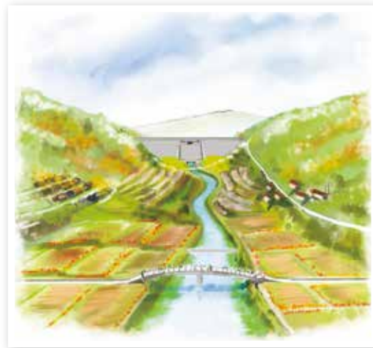
本明川ダム（完成イメージ図）