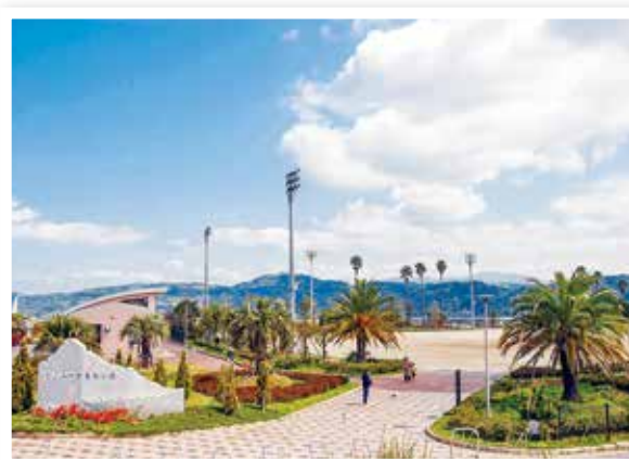
なごみの里運動公園

地域ごとにバランスのとれた公園整備を図るとともに、市民参加による緑化推進に努めます。また、河川愛護の意識の高揚を図り、地域住民やボランティア等の参加による河川の美化や清掃活動の支援を行い、市民が集う憩いの場として利用される空間づくりを目指します。