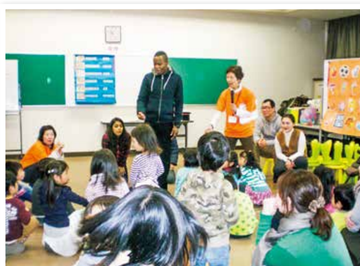
留学生と市民との交流会

文化や歴史、習慣などお互いの違いを認め合いつつ、国際交流及び国内交流を市民主体で推進します。