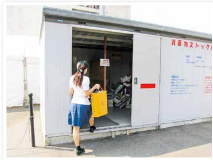
ごみ減量化・地域美化事業