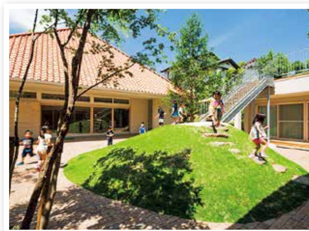
教育・保育施設（深山保育園）