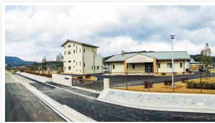
飯盛浄化センター

健康で快適な生活環境の実現のため、公共施設や交通拠点等における率直的なバリアフリーに対する取組の推進や、上・下水道の整備、各種生活基盤の整備を図ります。