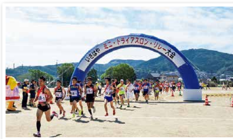
いさはや ミニ・トライアスロンリレー大会

スポーツ大会開催等により市民のスポーツ意欲を高め、スポーツ関連団体等と連携しながら、ジュニアからシニア層までの生涯スポーツの推進に取り組みます。