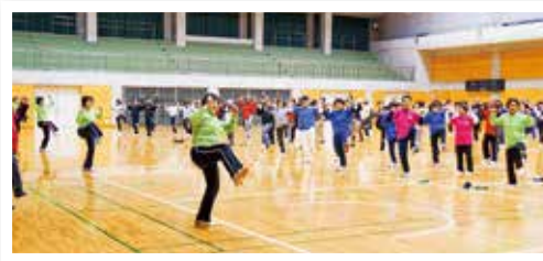
諫早市民生涯スポーツ大会