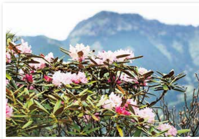
ツクシシャクナゲ

また、効率的・集約的な施業により林業の収益性の向上を図るとともに、広葉樹林や針葉樹林の整備を推進し、森林の有する多面的機能の向上を図ります。