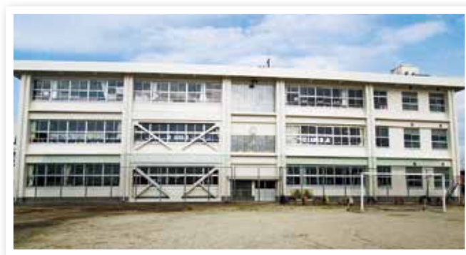
学校施設耐震補強・老朽改修事業