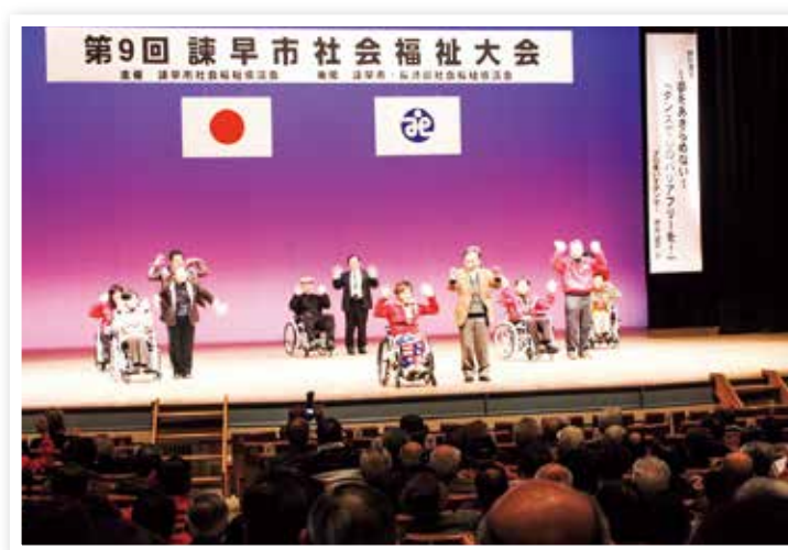
諫早市社会福祉大会

地域福祉の担い手の支援や育成に取り組み、地域での支え合いを促進するとともに、地域で相談・発見・解決できる仕組みづくりや、地域における見守り体制等の確立に努めます。