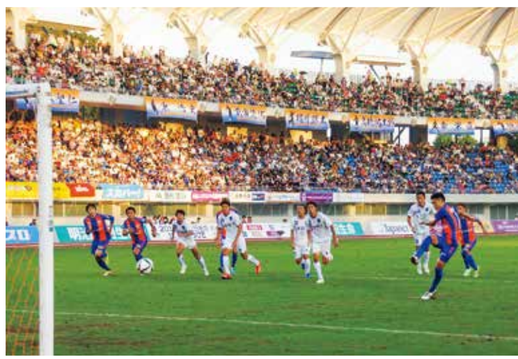
V・ファーレン長崎ホームゲーム

スポーツ・文化施設整備や豊かな自然を活かした交流環境づくりを行い、スポーツ大会などの開催や、プロスポーツを通して交流人口の拡大に努め、宿泊者等の増加による地域活性化を図ります。