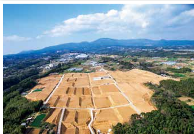
圃場整備（小豆崎地区）

認定農業者や農業生産法人等の育成、新規就農者の確保を図り、農業生産基盤の整備、農産物のブランド化を推進するとともに、自然環境の保全や多面的機能 ※1 の維持・増進による資源循環型社会 ※2 の構築を目指します。