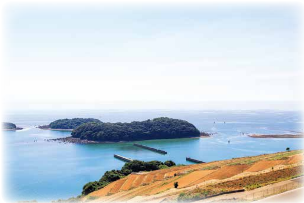
前ノ島と向島（飯盛地域）