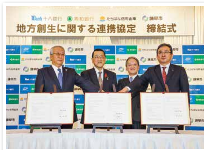
金融機関との連携協定締結式

また、近隣市町との連携強化を図りながら広域的な課題に対応するとともに、大学、金融機関と連携してまちづくりを進めます。