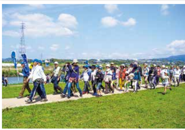
健康づくりのための「市民ウォーキング」

国民健康保険事業については、安定的な運営のために財源の確保と医療費の適正化を図ります。