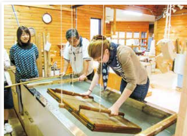
湯江紙 紙すき体験

良好な地域社会の維持のため集会所の機能維持に努め、自治会への加入を促進し、自治活動を支援することにより、地域のつながりを守るとともに市民協働による特色ある地域づくりを推進します。