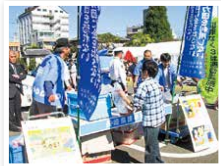
暴排・地域安全活動