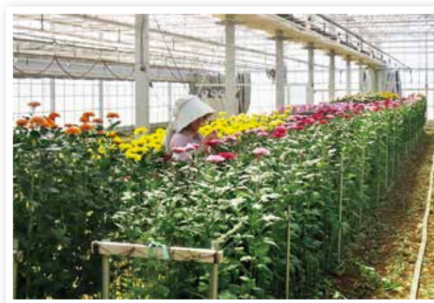
園芸施設整備によるキクの安定生産