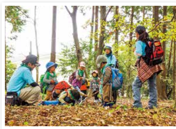
森での自然体験活動