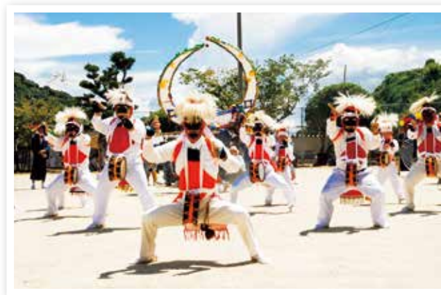
田結浮立（県指定無形民俗文化財） ※平成27年度地域文化功労者文部科学大臣賞受賞