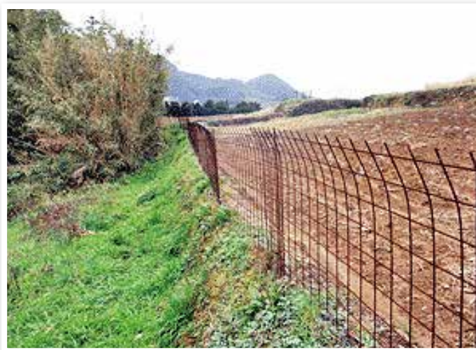
有害鳥獣被害防止対策