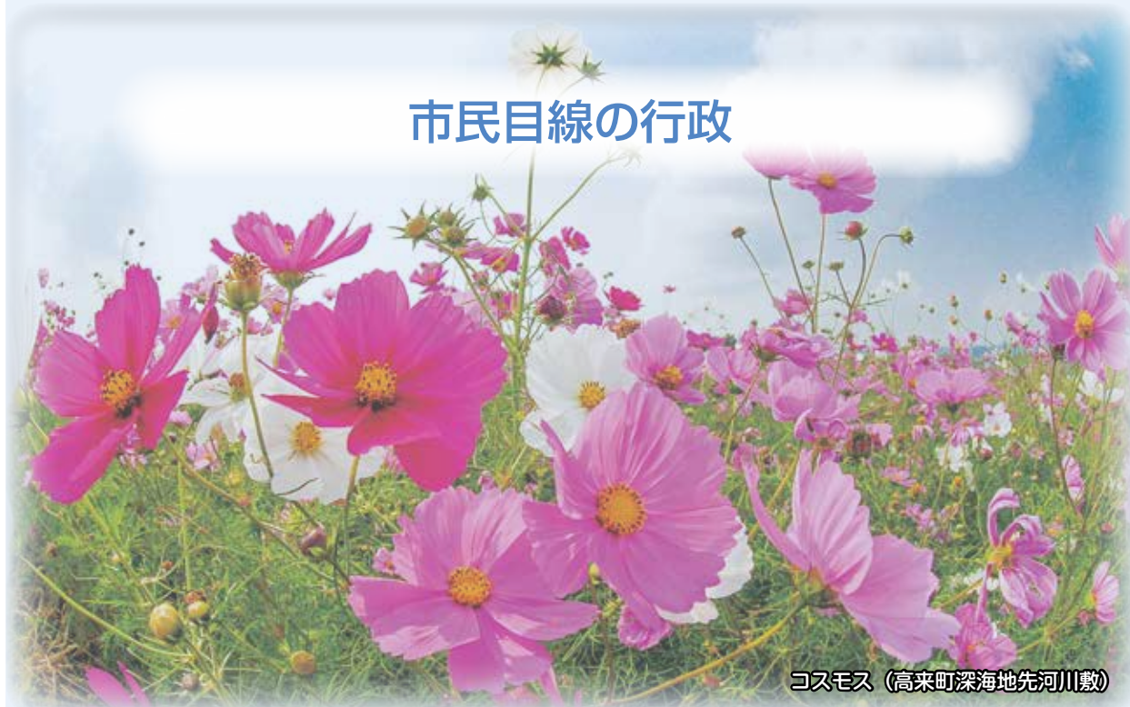
コスモス（高来町深海地先河川敷）

公正かつ透明性の高い行政運営を推進するため、情報公開制度の充実など市民自治の観点から幅広い情報の提供に努め、開かれた市政の推進を図ります。