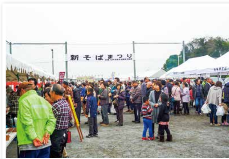
幻の高来そば新そばまつり

特色ある地場製品の加工販売や新商品開発等に取り組み、県内外で開催される各種物産展や企業の商談会への積極的参加に支援します。