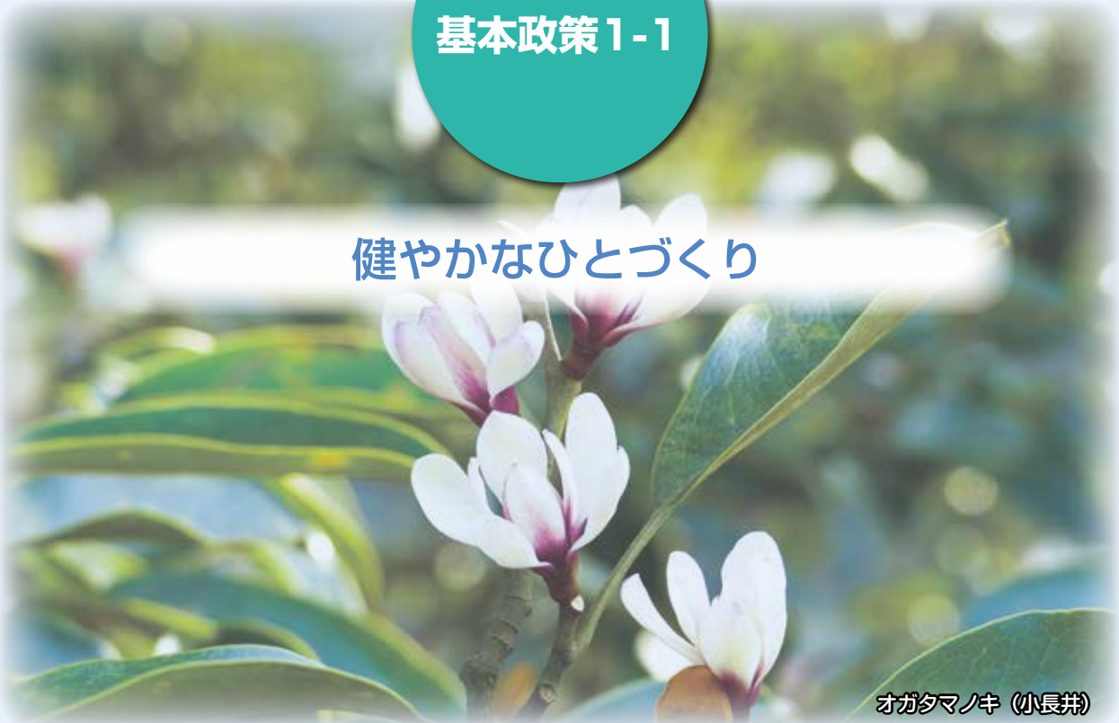
オガタマノキ (小長井)

結婚、妊娠、出産から子育てまでの切れ目のない支援体制の構築を図ることで、誰もが安心して子どもを産み育てることができるまちづくりを目指します。