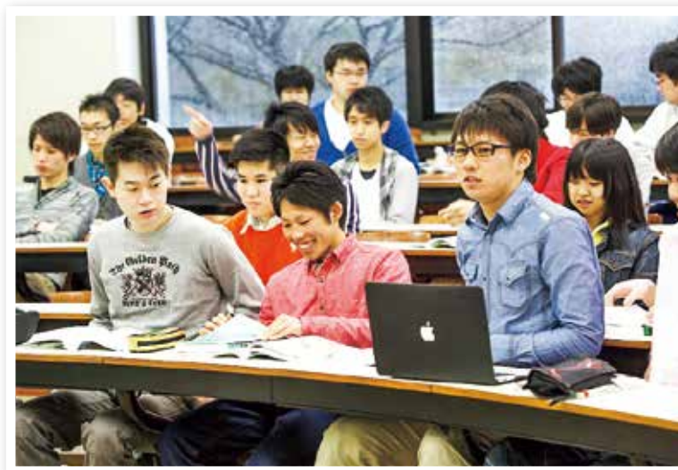
いさはやコンピュータ・カレッジの授業風景