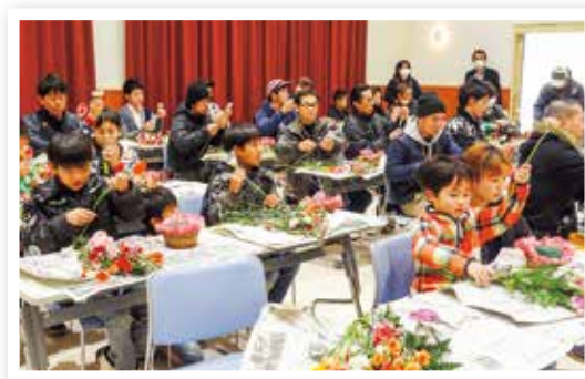
フラワーバレンタイン&amp;特産品推進事業