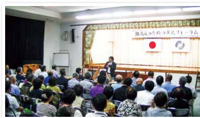
防減災のための市民フォーラム（森山地区社会福祉協議会）