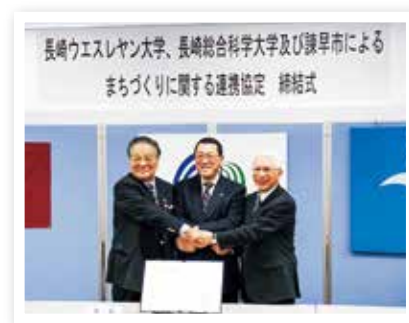
大学との連携協定締結式