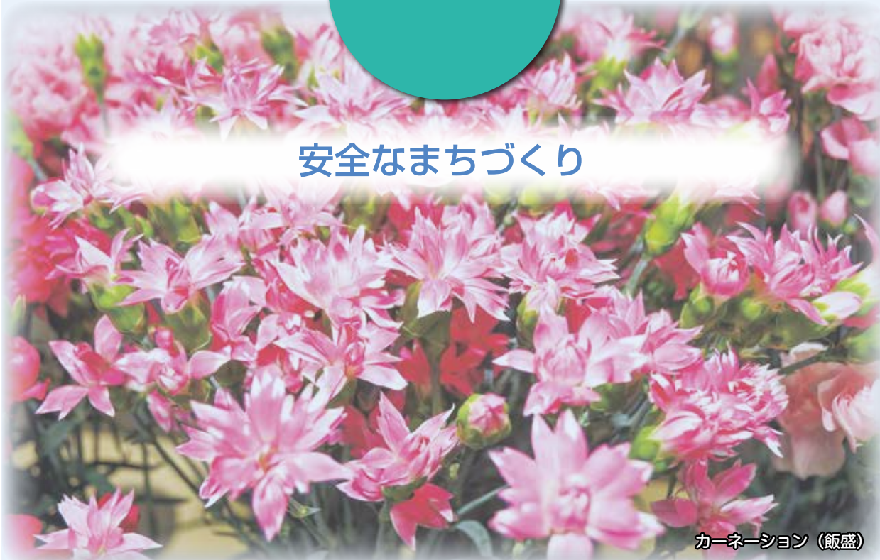
カーネーション（飯盛）

本市は地理的に集中豪雨や台風などの影響を受けやすく、過去に幾多の災害が発生し、多くの尊い生命や財産が失われています。近年の異常気象により引き起こされる洪水・土砂災害や津波・高潮等の被害の拡大を抑えるため、治水対策及び消防防災体制を検証し、地域防災力の強化による災害に強いまちづくりを進めます。