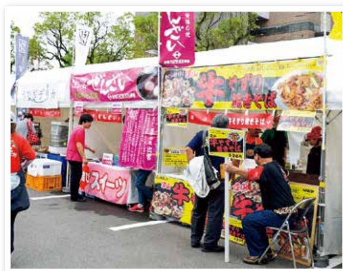
三市友好交流物産展