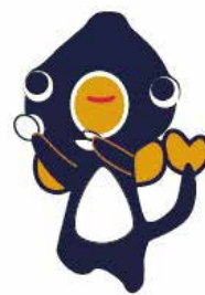
うなぎの妖精「うないさん」