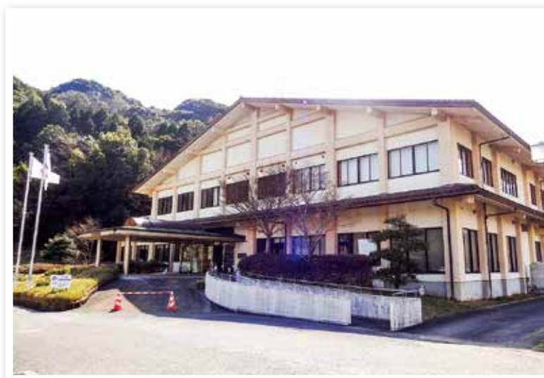
つくば倶楽部（勤労者福祉施設）

地域の雇用や産業振興への取組に対して支援を行うとともに、有能な人材の育成と勤労者の福祉の増進を図ります。