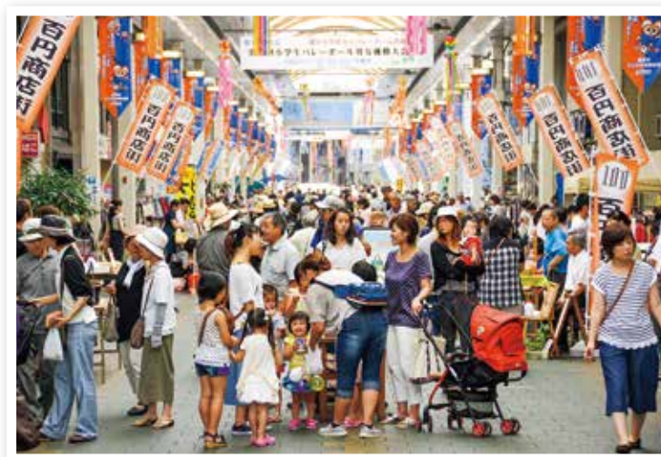
100円商店街（アエル中央商店街）

魅力あるまちづくりのための商業基盤施設の整備や各種ソフト事業を支援するとともに、中小企業の経営安定や資金力の強化など、商工団体等への支援を行います。