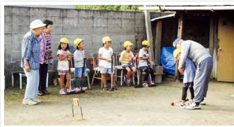
放課後子ども教室