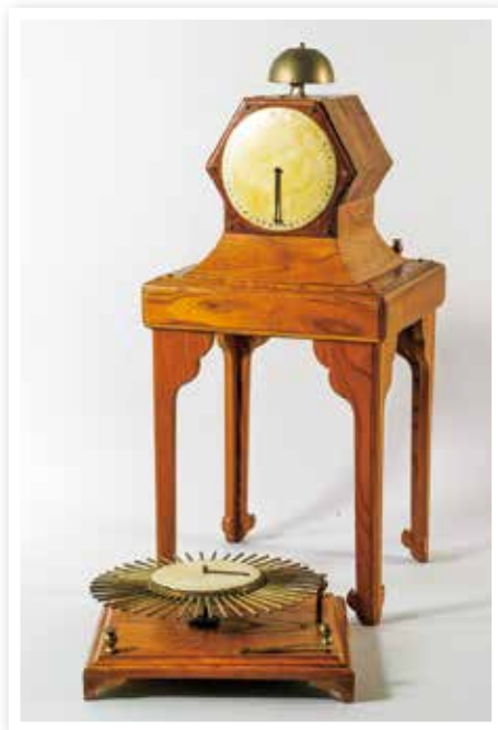
エーセルテレカラフ（国指定重要文化財）

歴史や文化財については、学術的な調査と適正な保存管理を行い、また地域の民俗芸能や伝統行事については、広く情報発信を行うとともに、次世代へ継承するための担い手育成を支援します。