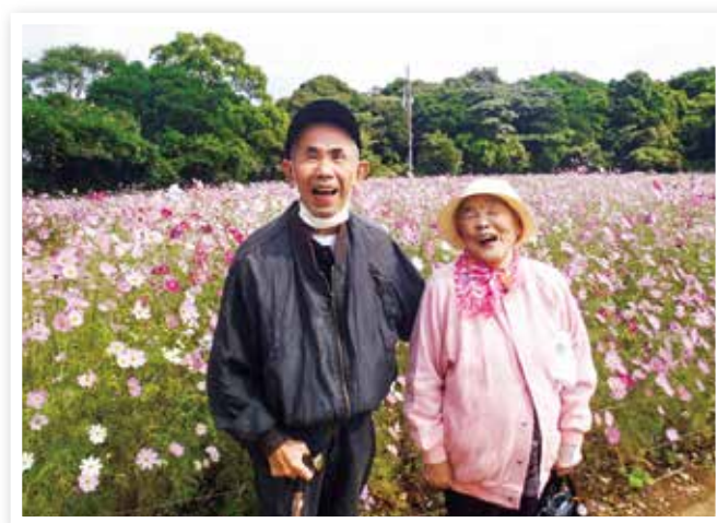
第2回長崎県老人福祉協議会「介護の日」 フォトコンテスト県知事賞受賞作品 「最高の笑顔～コスモス畑」

高齢者が住み慣れた地域で安心した生活を継続できるよう、地域包括ケアシステムを構築するとともに、在宅サービス及び施設サービスの適正な水準の維持を目指します。