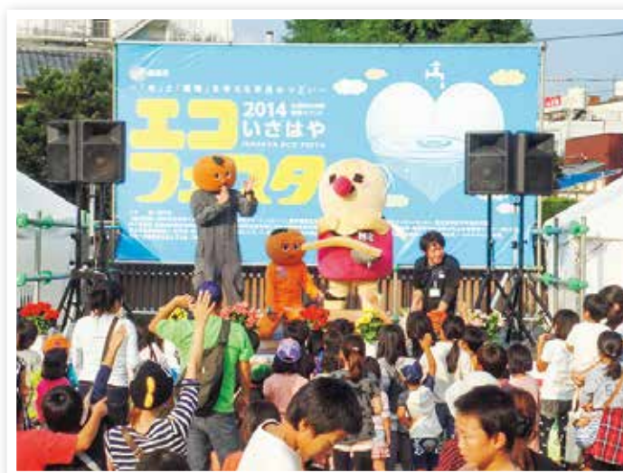
いさはやエコフェスタ

環境への負荷ができるだけ低減される社会を形成するため、ごみの排出抑制・再資源化を推進するとともに、行政、事業者、市民団体が協働して、環境保全活動に取り組んでいきます。