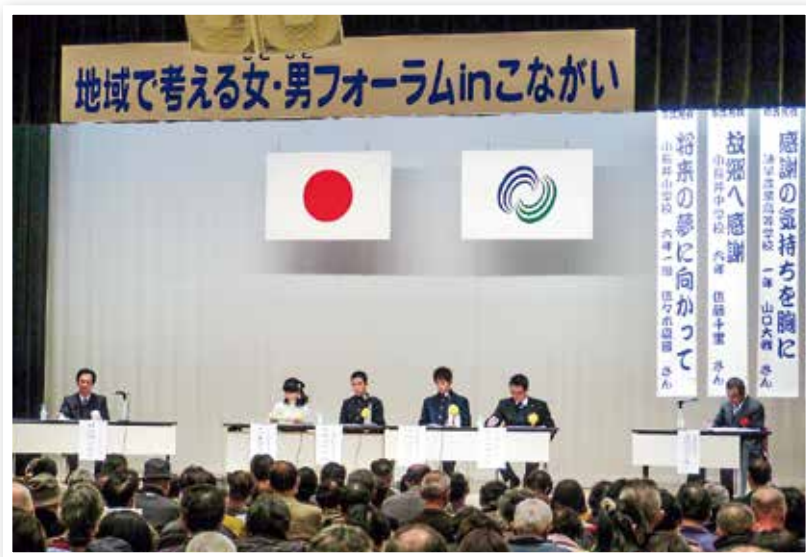
地域で考える女・男 ひと フォーラム in こながい

男女共同参画意識の啓発を図るフォーラム等の開催、広報活動により男女共同参画社会への理解を深める取組を行うとともに、起業についての基礎知識や再就職に必要なスキルの習得を促進する体制づくりを推進します。