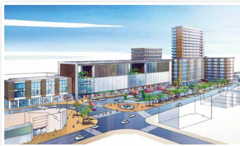
諫早駅東地区第二種市街地再開発事業イメージ