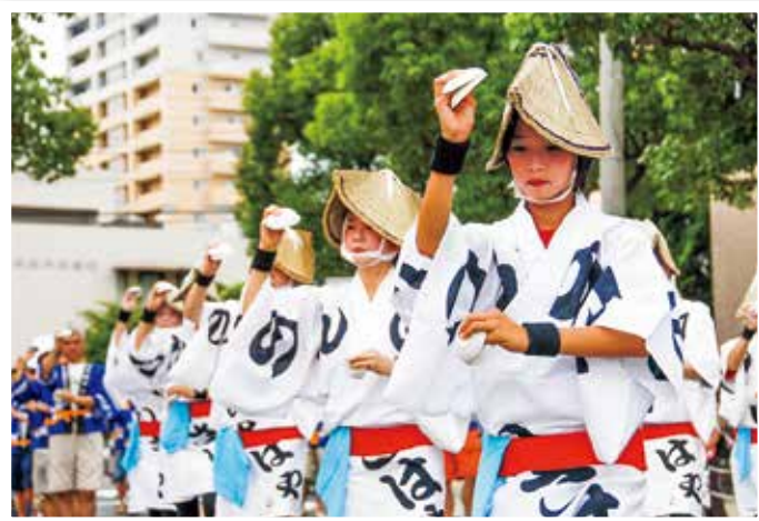
のんのご諫早まつり