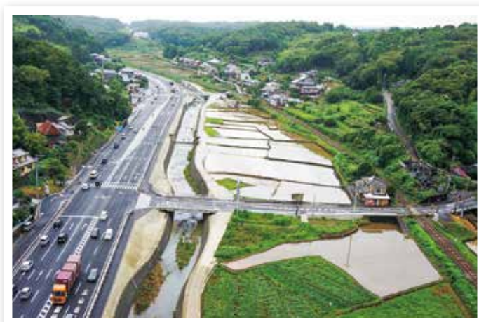
整備中の一般国道34号（本野入口交差点付近）

九州新幹線西九州ルート（長崎ルート）の開業に向けて事業を推進するとともに、国道・県道の拡幅や地域高規格道路の早期整備、港湾施設の管理など、地域の生活に密着した交通網の拡充を図ります。