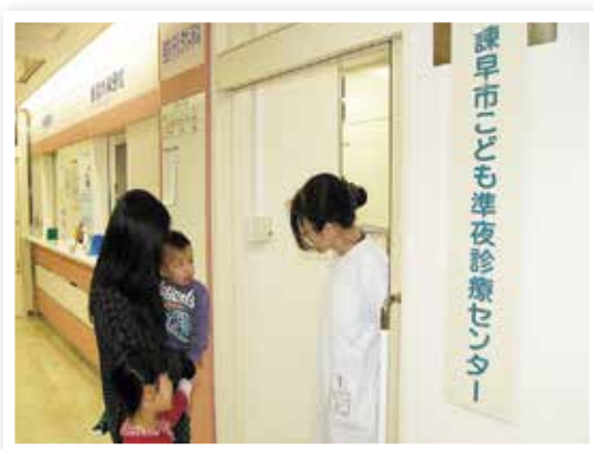
こども準夜診療センター