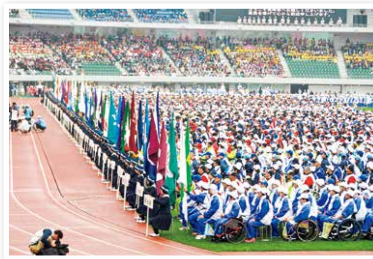
全国障害者スポーツ大会（長崎がんばらんば大会）