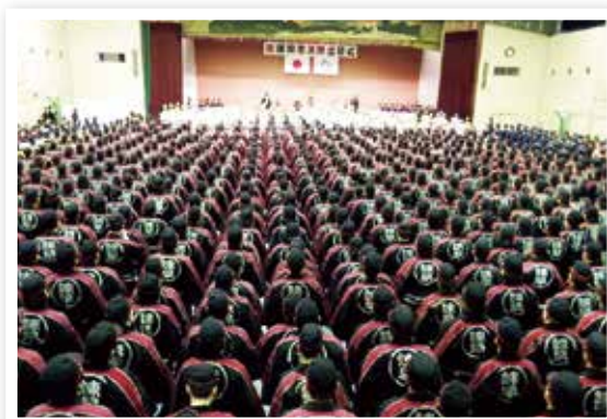
諫早市消防出初式

河川改修や急傾斜地崩壊対策などの治水対策及び消防団活動の推進や防災情報の伝達など消防防災体制を確立するとともに、市民の防災意識の向上による地域防災力の強化を図り、災害に強いまちづくりを推進します。