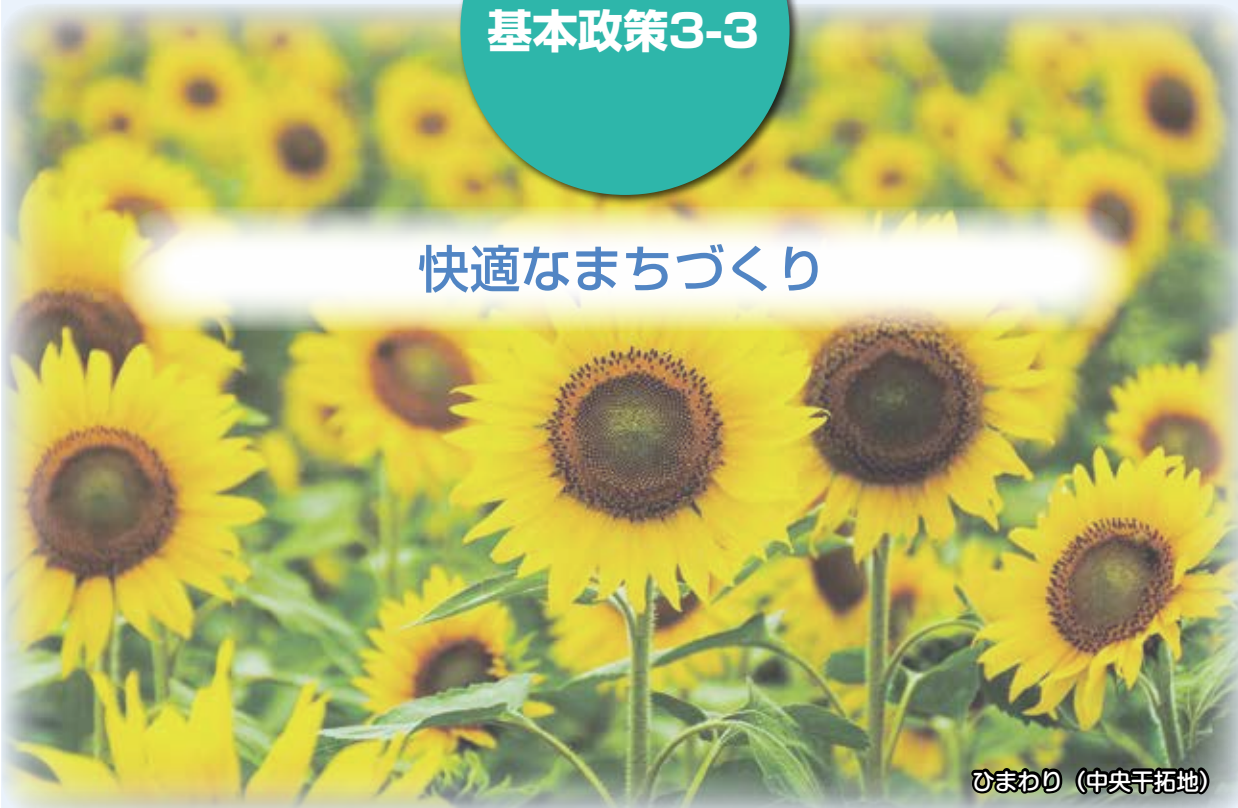
ひまわり（中央干拓地）

新幹線開業を踏まえ、新しい時代環境に適応した広域交通網の整備と都市機能の充実を図り、良好な市街地や住環境を形成します。また、豊かな自然環境を活かした公園や森林・河川の整備をはじめ、市民生活の利便性を高める道路網や、公共交通等の総合的な維持連携、強化を図ります。