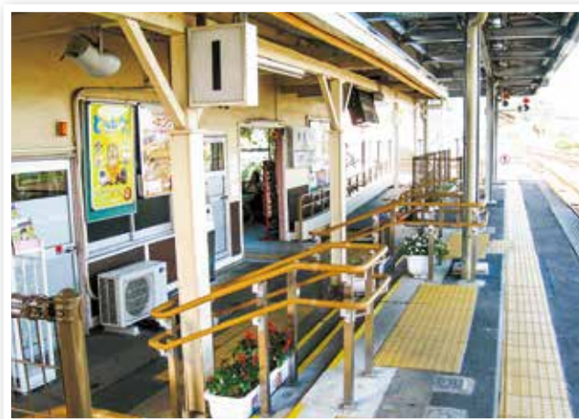
喜々津駅構内のバリアフリー化