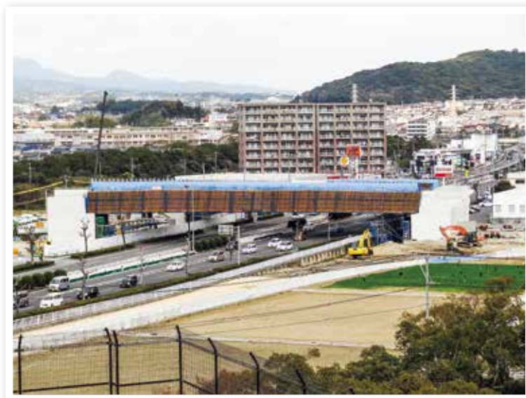
整備中の一般県道諫早外環状線（(仮称)貝津橋 I C 付近）