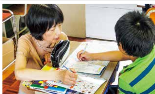
学力向上支援事業

いじめ・不登校の防止に向けては、相談員の配置や関係機関・団体との連携により、総合的かつ効果的に推進します。