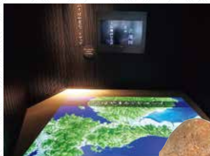
土偶 (西常盤貝塚出土)

タッチパネル式のデジタル年表や床に投影された地図を足で操作することで、諫早の移り変わりを学ぶことができます。