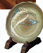
刷毛地色絵木葉文輪花鉢 (現川焼)