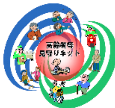
諫早市高齢者等見守りネットワーク活動支援事業 啓発用シンボルマーク