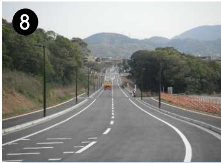
市道堀の内西栄田線(道路新設)