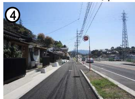
国道207号[宇都工区](歩道整備)