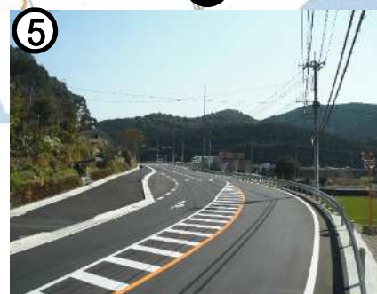
県道諫早飯盛線[土師野尾工区] (道路拡幅)