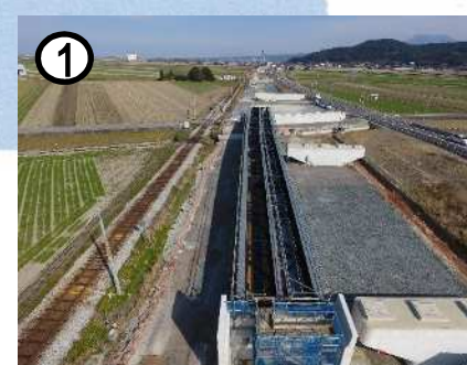
国道57号[森山拡幅] (自動車専用道路)