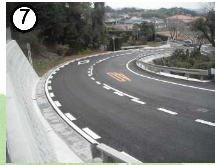
県道小長井線(道路拡幅)