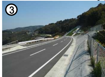
国道207号[佐瀬工区](道路拡幅)