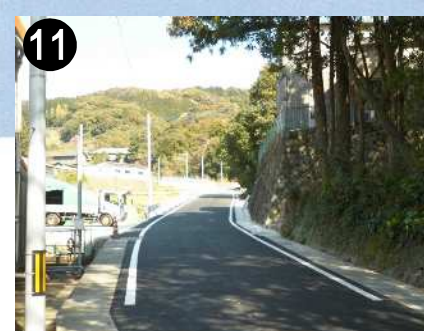
市道上原線(道路拡幅)