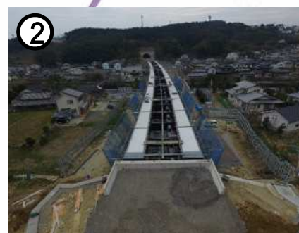
県道諫早外環状線[長野町～貝津町] (自動車専用道路)