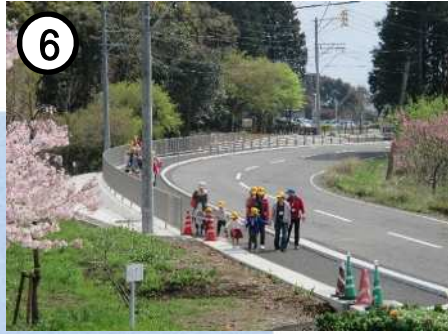
県道諫早多良岳線(歩道整備)