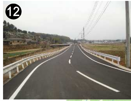
市道橋詰線(道路拡幅)