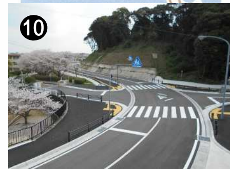
市道永昌真崎津水線(歩道整備)