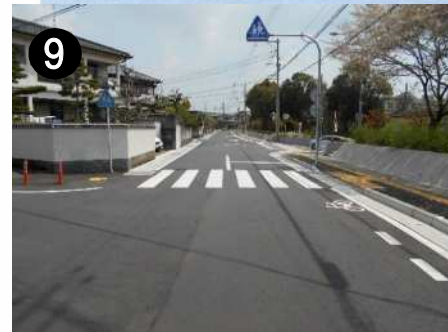
市道馬渡小船越線(歩道整備)