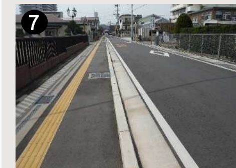
⑦ 市道厚生町仲沖線(歩道整備)