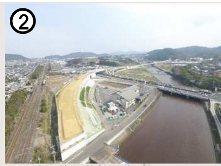
② 県道諫早外環状線【諫早インター工区】(自動車専用道路)