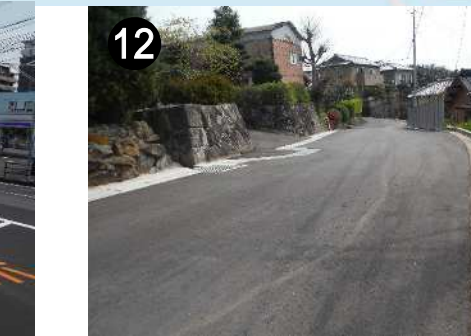
⑫ 市道下方線(道路整備)