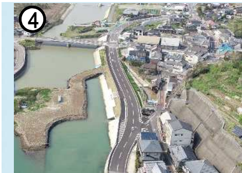
④ 県道諫早飯盛線【江の浦工区】(道路整備)