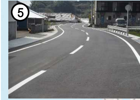
⑤ 県道多良岳公園線【神津倉工区】(道路整備)