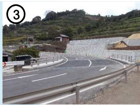
③ 国道207号【佐瀬拡幅】(道路整備)