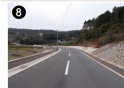
⑧ 市道天神早見線(歩道整備)