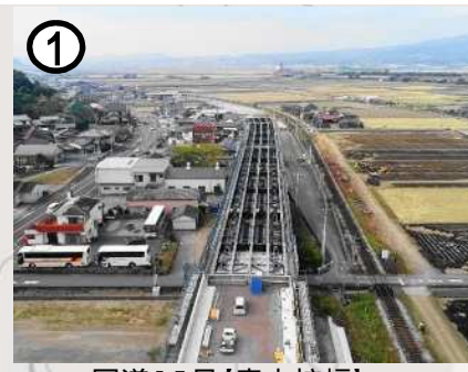
① 国道57号【森山拡幅】(自動車専用道路)