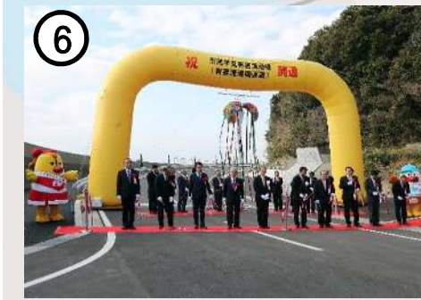
⑥ 市道早見有喜漁港線(有喜漁港関連道)