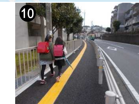
⑩ 市道小川夫婦木線(歩道整備)