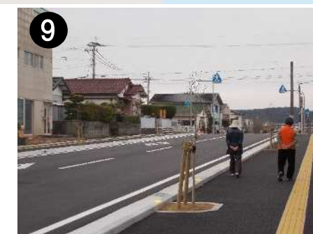
⑨ 市道真崎貝津線(歩道整備)