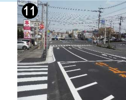
⑪ 市道西諫早中央線(道路整備)