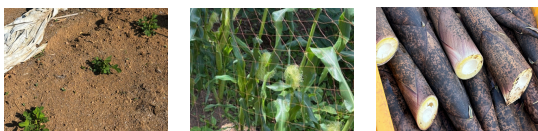
落花生 トウモロコシ 破竹