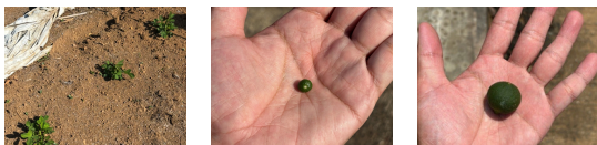
トマト 5/18 みかん 6/13 みかん

遠竹地区でみかん農家をしている宮崎さん。宮崎さんはみかん栽培(5種類)を主にしていますが、そのほかに、ししとう・ピーマン・オクラ・なす・ねぎ・きゅうり・つくね芋・つわ・胡椒・えだまめ・かぼちゃ・トマト・とうもろこし・しょうが・みょうが・大根・いんげん・すいか・落花生・栗・柿・桃・びわ、とたくさんの種類の作物を季節を通じて作っています。みかんの品種は岩崎、原口、大津、させぼ、青島の5種。なかでも原口は宮崎さんのお気に入り。とにかく美味しいみかんを食べてもらいたい。剪定・摘果・収穫の計画を入念にし、以前の職場の自衛隊の先輩・後輩たちに支援をいただき、楽しくやられています。また、作ったみかんを食べた人が喜んでくれたらと、笑顔で話していました。冬が楽しみです。