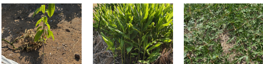
ポポー しょうが スイカ

先日、小長井中学校2，3年生を対象に小長井についてのトークセッションがありました。小長井は過疎地域としてみなされており、今後のあり方を中学生・町おこし隊の皆さんと話しました。大きなことはできないかもしれませんが一番大切なことは、一人ひとりが小長井は故郷であり、いつでも戻ってこれる大切な場所であり続けることであると私は思いました。今後、3年生は卒業後に向けて頑張り、2年生は学校のリーダーになる学年に向けて活動していきます。熱い気持ちを持ち、『小長井出身の人は元気が良い!』とどんな場面でも力強いことが小長井の魅力になっていくと思います。私も負けずに頑張っていきます。