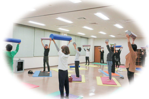
生涯学習の推進(公民館講座)