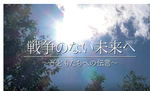
戦争・被爆体験証言映像の公開