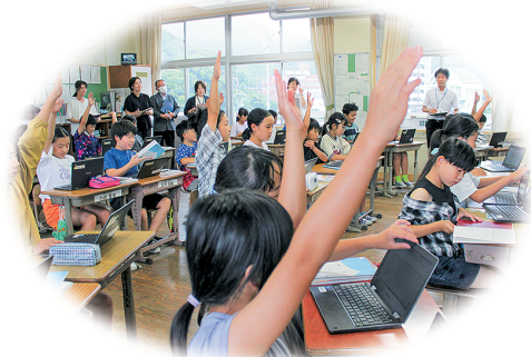
確かな学力を育成する学校教育