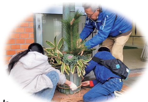
地域と連携した青少年健全育成

地域の子どもが地域で育ち、 そこで育った子どもが将来、 その地域の子どもを育てる好循環のまち