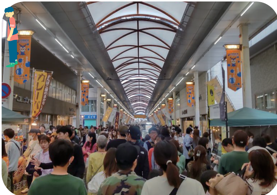
アエル中央商店街