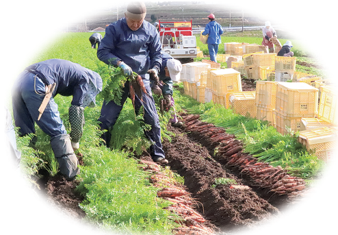
生産性向上など次世代につなげる農業の展開