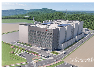
企業誘致による工場等設置