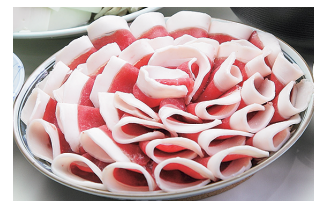
ジビエを活用した料理