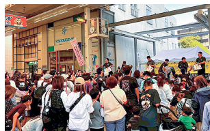
商店街でのイベント