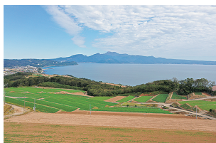
環境保全を意識した農業生産