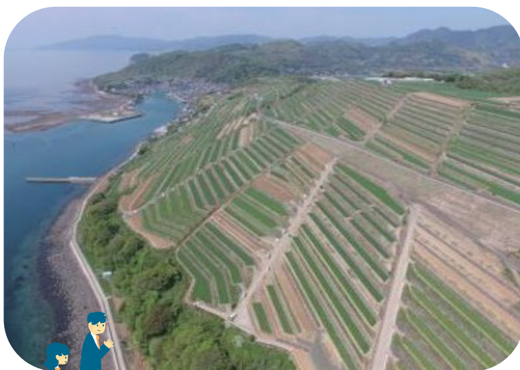
広大な畑作地帯 (飯盛地域)