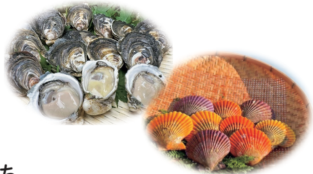
水産業の振興(牡蠣やヒオウギ貝養殖)