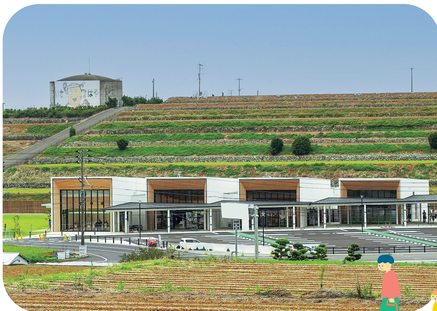
道の駅251 いいもりじゃがーロード