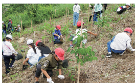
市民参加による森づくり