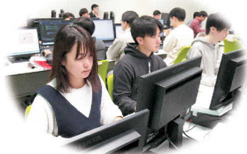
いさはやコンピュータ・カレッジの授業風景