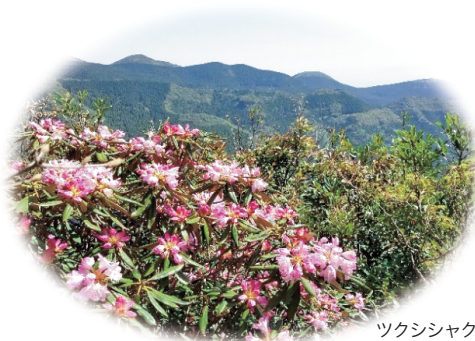
ツクシシャクナゲ

「伐 き って、使 っ て、植 え て、育 て る」 森林資源の循環利用を推進し、 持続可能な森林・林業が 発展しているまち