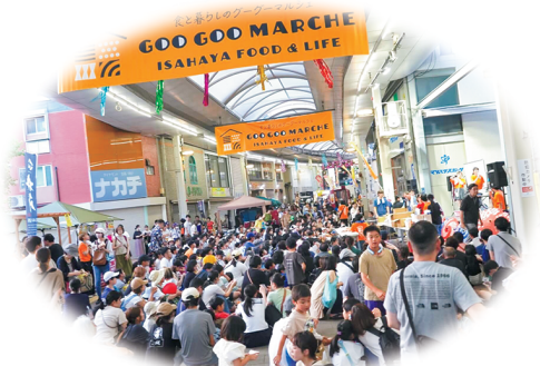
マルシェイベント(アエル中央商店街)