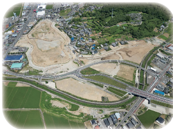
島原道路長野インターチェンジ周辺

駅周辺の利便性や賑わいを向上させ、活気ある拠点として再生する取組が必要だと思う。