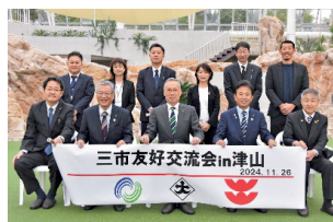
出雲市・津山市との交流