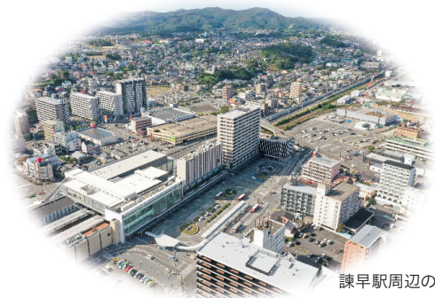
諫早駅周辺の風景