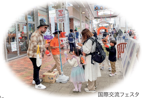
国際交流フェスタ