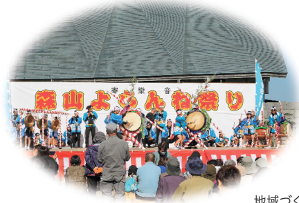
地域づくり協働事業

良好な地域社会の維持のため 自治会活動を支援することにより、 地域のつながりを守るとともに、 市民協働による特色のあるまち