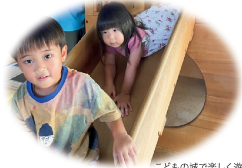
こどもの城で楽しく遊ぼう！