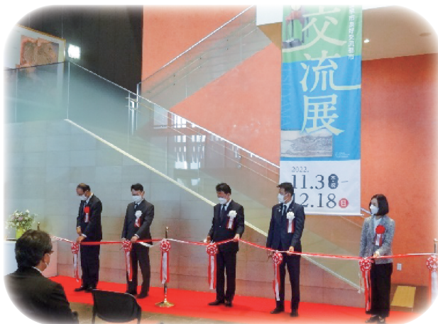
三市交流展(歴史・文化交流)