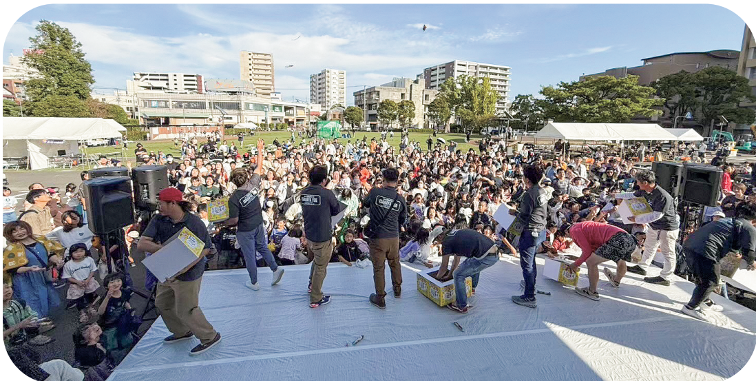
アエルコドモフェス