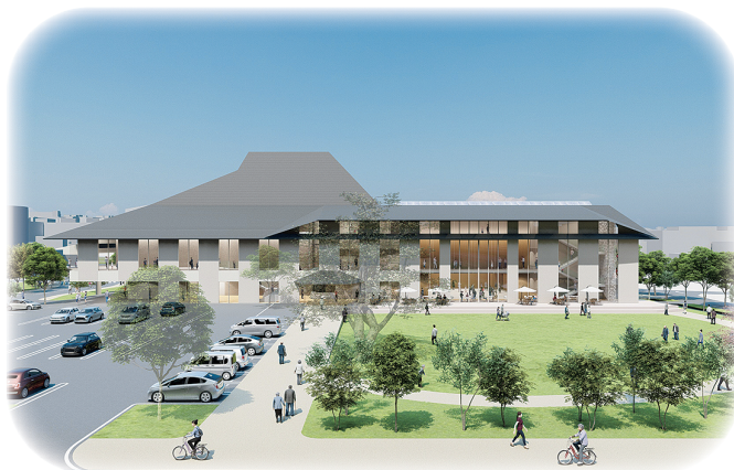
(仮称)市民交流センター(イメージ)