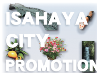
シティプロモーション戦略

「住みたい」、「住んでみたい」と感じてもらえる、誰にとっても「住みよい」、「選ばれる」まちの実現のため、市民が地元に対して誇りや愛着を持ち、行政と共に市の魅力発信を行うまち