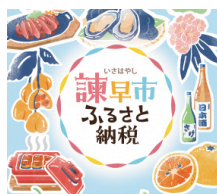
ふるさと納税による地域PR