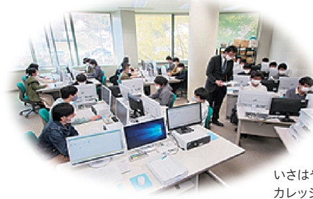
いさはやコンピュータ・カレッジの授業風景