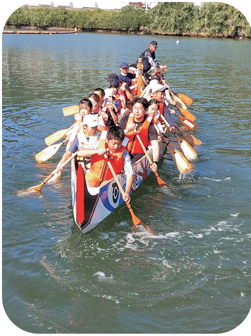
たらみ海辺の学校