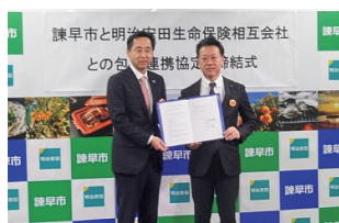
民間企業等との包括連携*