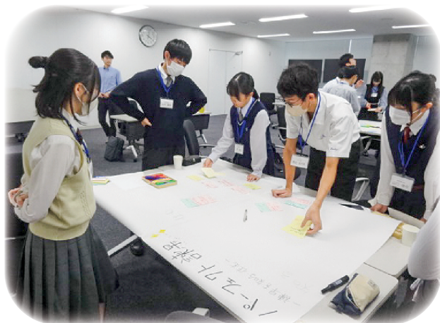
高校生ワークショップ