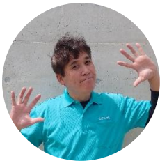
おんじ (こどもの城スタッフ)