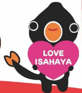
諫早おもてなし大使 諫早のうなぎの妖精 うないさん