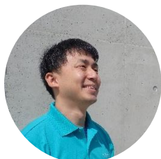
ウォーリー（こどもの城スタッフ）