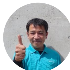
今月の担当：のっち（こどもの城スタッフ）