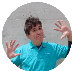
おんじ（こどもの城スタッフ）