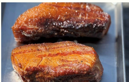
自家製 豚肉燻製ベーコン