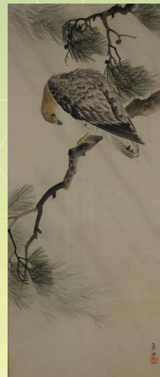
▲「松鷹図」 小波魚江 筆