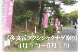
【多良岳ツクシシャクナゲ祭り】 4月下旬～5月上旬