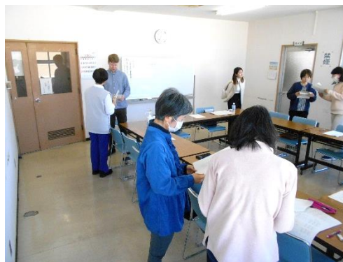
2/14,21,28 「Helloからはじまる英会話」