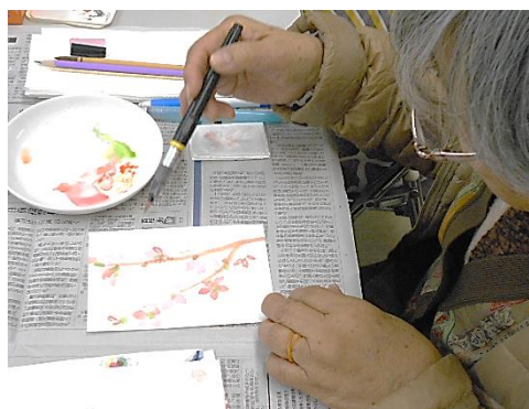
2/10,17,24 「はじめての絵手紙」