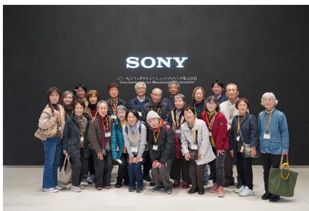
2/25 明生教室⑩「バス研修」