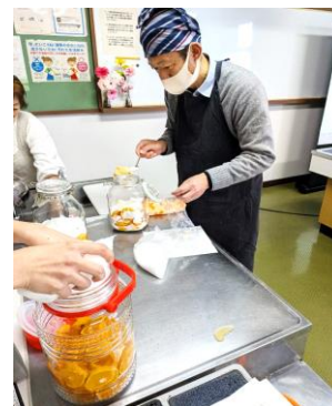
1/21伊木カ公民館 「伊木カみかんで酵素ジュース」