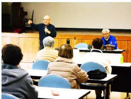
1/20明生教室◎ 「なつかしの昭和歌謡」