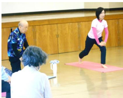
12/16 「気軽にストレッチ」