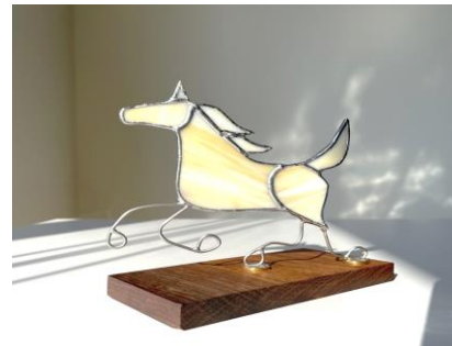
12/20伊木カ公民館「ガラスの干支づくりを楽しむ」(講師作品)