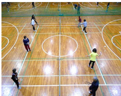
11/28,12/12,12/19 「気軽にバウンドテニス」