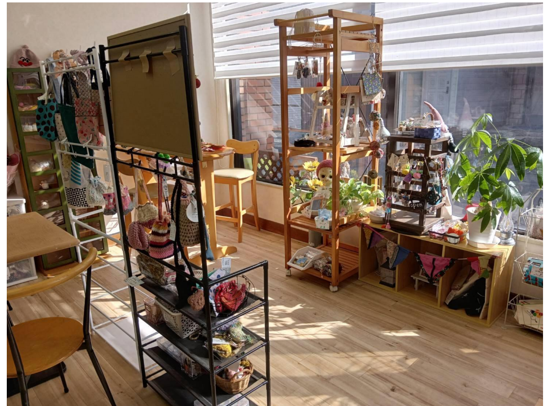
事業所内雑貨販売