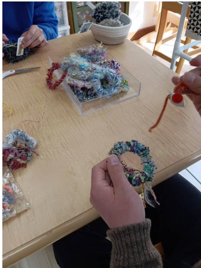
手作り雑貨制作 値札付け