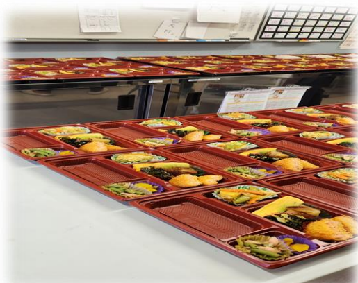
お弁当の盛り付け