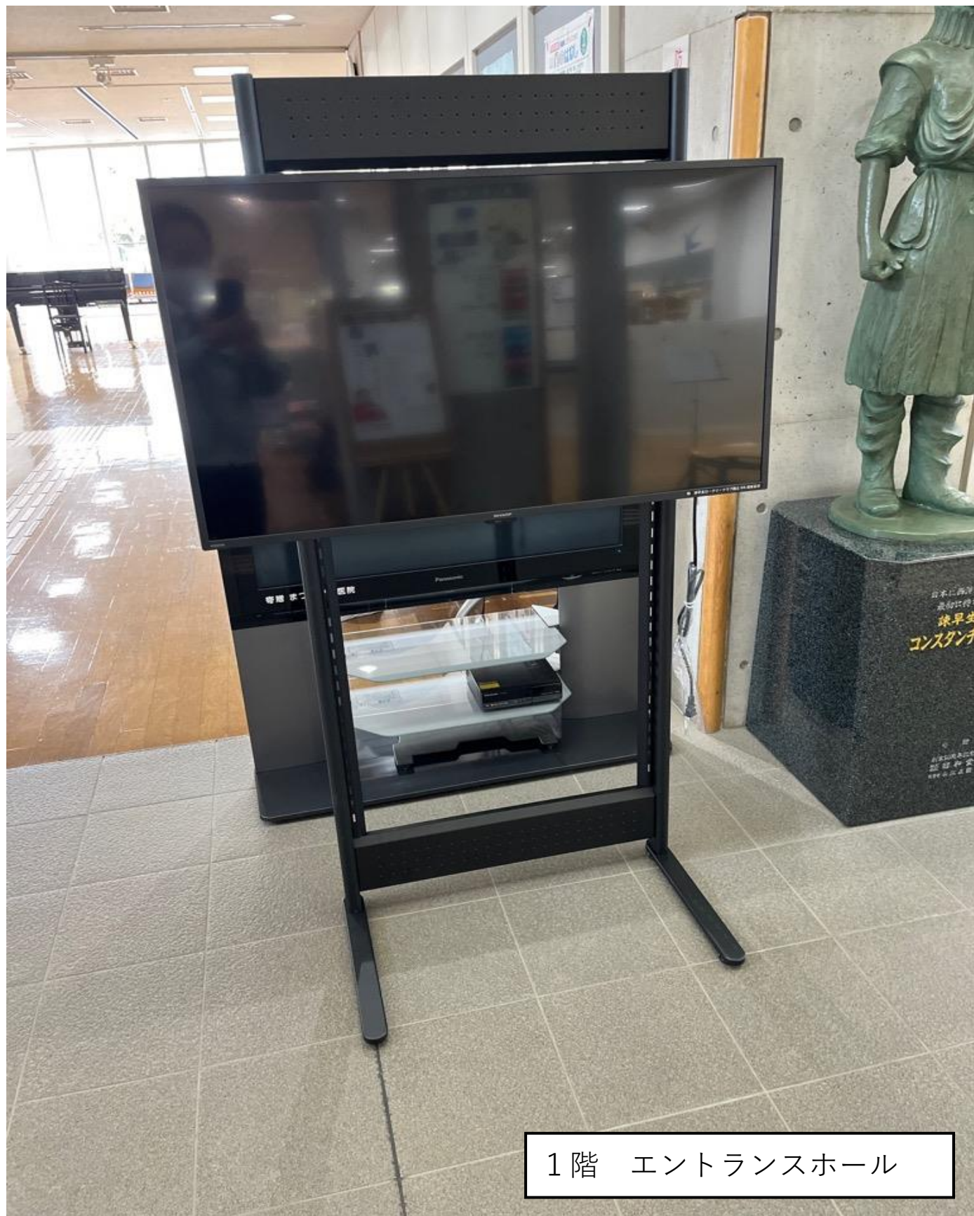
1階 エントランスホール