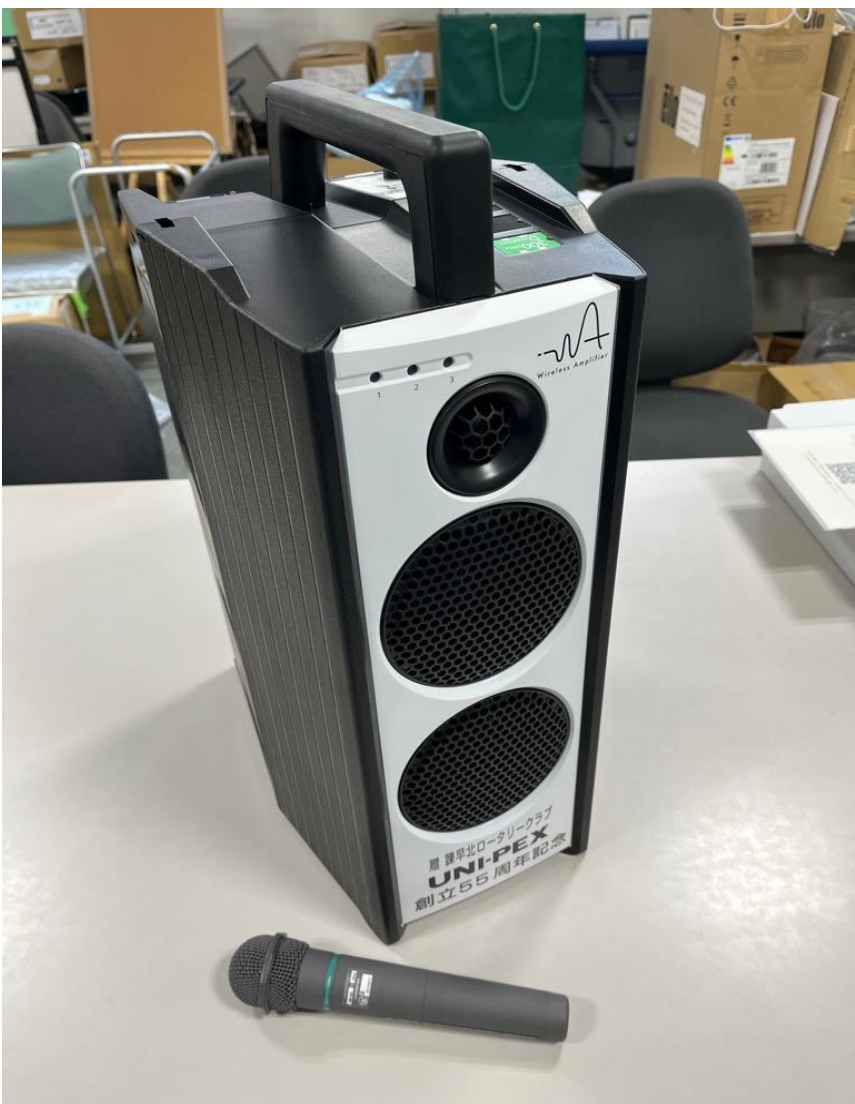
③ワイヤレスアンプ・マイク