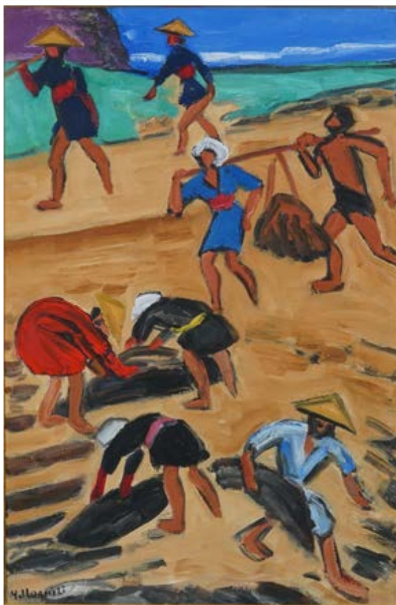
▲「働く人々」(1957) 美術・歴史館所蔵