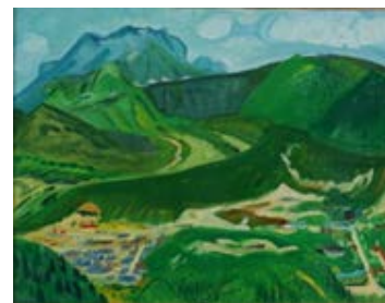
▲「雲仙」(1953) 美術・歴史館所蔵