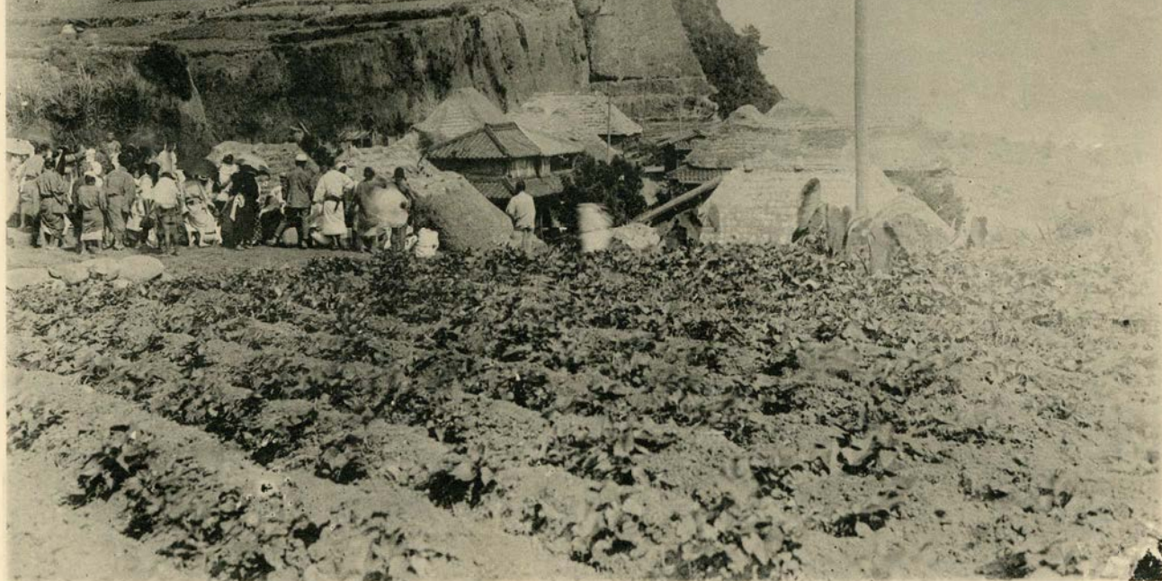
有喜貝塚発掘風景