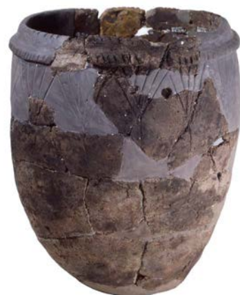
▲出土品「伊木力式土器」(伊木力遺跡)