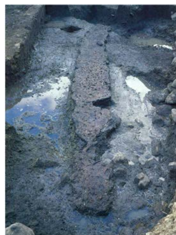
出土品「丸木舟」(伊木力遺跡) ▶