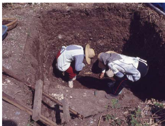
▲発掘調査風景(有喜貝塚)

諫早市は橘湾・有明海・大村湾の3つの海に囲まれ、古来より海の恩恵を受けてきました。市内には、有明海をのぞむ「西常盤貝塚」、大村湾をのぞむ「伊木力遺跡」があり、橘湾をのぞむ「有喜貝塚」の資料と同時に展示することで、それぞれの貝塚の特徴や縄文時代における3つの海を介した活発な交流の様子を明らかにします。