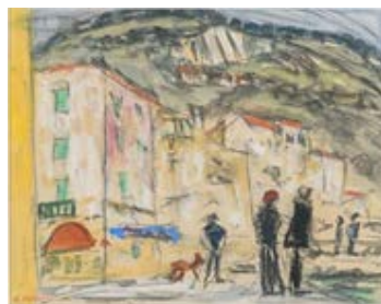
▲「ビルフランシュ風景」(1960) 美術・歴史館所蔵