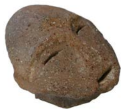
◀出土品「土偶頭部」 （西常盤貝塚）