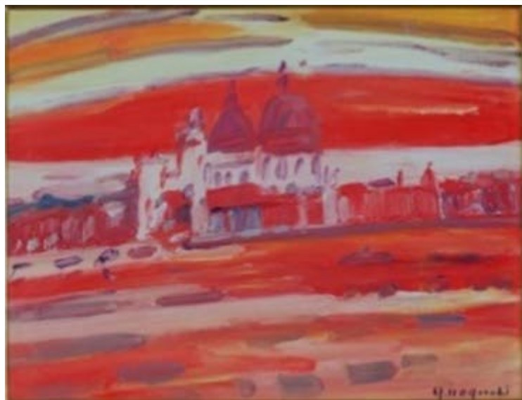
▲「ヴェニス」(1966) 美術・歴史館所蔵