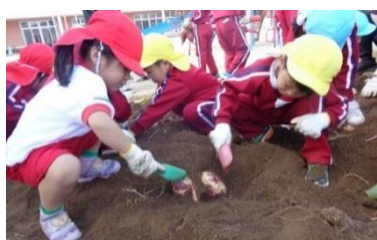
大きなさつま芋大収穫