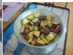
芋を洗ってふかし芋に。美味しかったね。