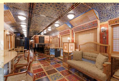
※特急 ふたつ星4047の(内観)イメージ