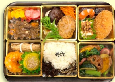
※杏てい特製弁当イメージ