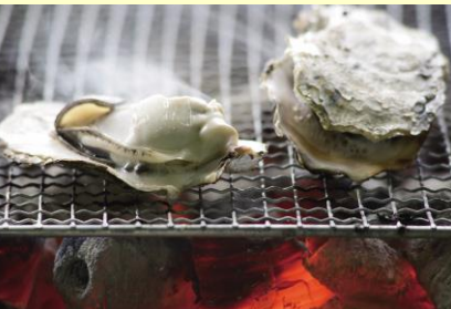
※小長井牡蠣のふるまいイメージ