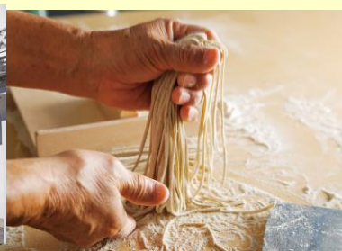
※幻の高来そばのふるまいイメージ