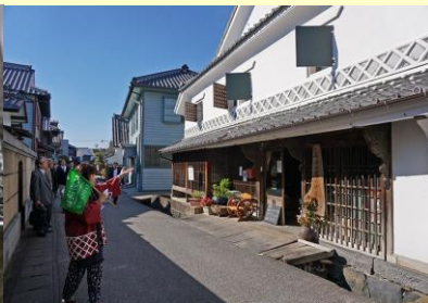
※肥前浜宿まちなみガイド散策のイメージ