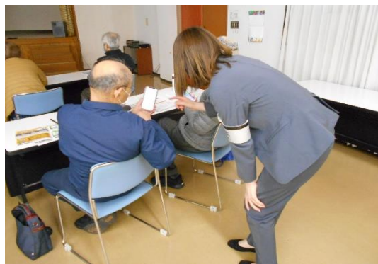
2/18 スマホをもっと使いこなす講座 ～防災に役立つアプリ～」