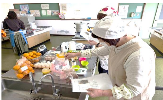
1/22 伊木カ公民館「果物を使ったお菓子作り」