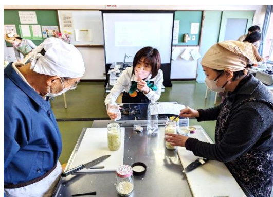
2/19 伊木カ公民館「やさしいこうじ教室」