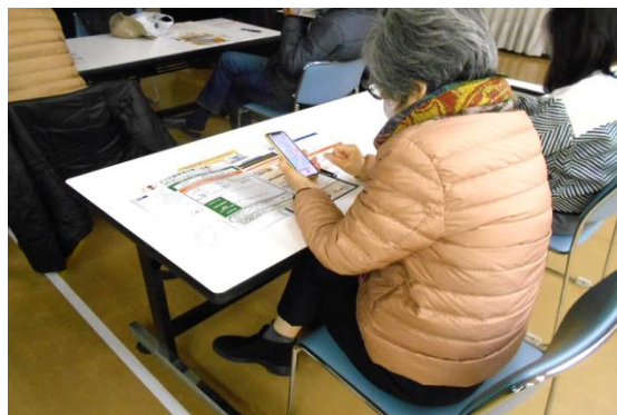
1/28 「スマホをもっと使いこなす講座 ～LINEとスマホ決済～」