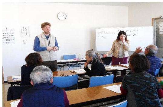
2/15,22,3/1 「はじめての英会話」