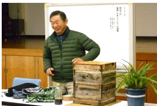
2/15,3/1 「初めての養蜂に挑戦」