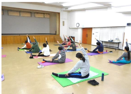
2/25 「気軽にタイ式ヨガ③」